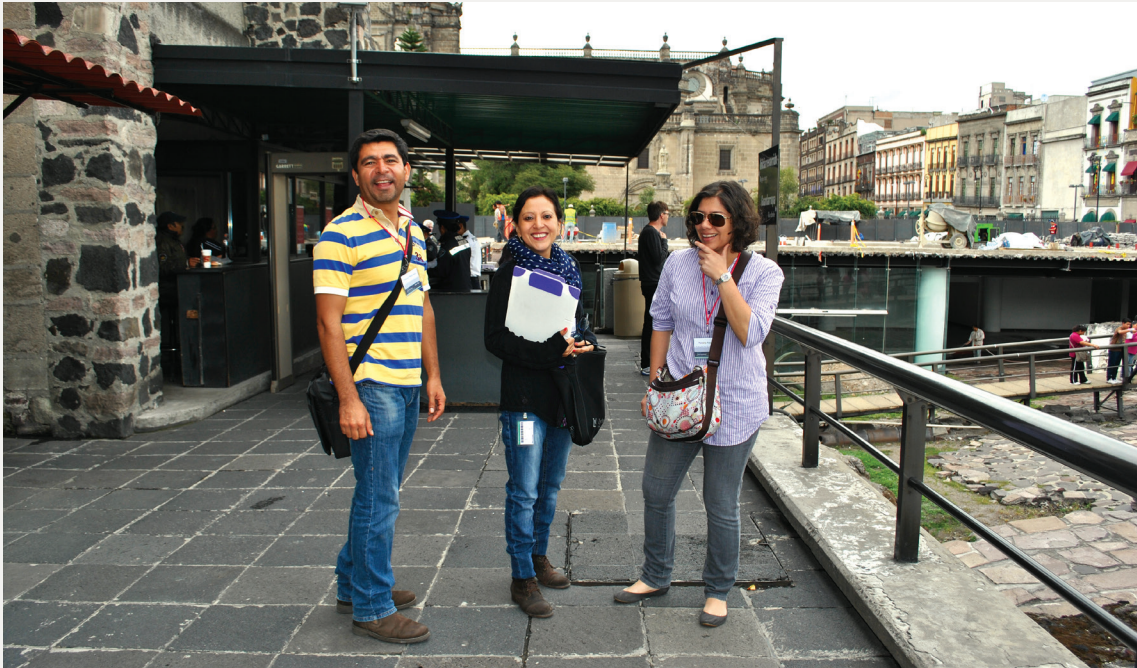
► Figura 1. El equipo de trabajo.

“ El propósito del ejercicio fue aplicar los conocimientos adquiridos en el aula sobre las técnicas cualitativas de investigación. Durante el módulo, diseñamos un modelo de entrevista cualitativa para aplicarla posteriormente a visitantes del Museo del Templo Mayor de Ciudad de México. ”