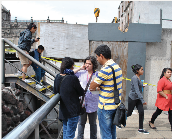
► Figura 2. Durante la aplicación de entrevistas.

“ El propósito del ejercicio fue aplicar los conocimientos adquiridos en el aula sobre las técnicas cualitativas de investigación. Durante el módulo, diseñamos un modelo de entrevista cualitativa para aplicarla posteriormente a visitantes del Museo del Templo Mayor de Ciudad de México. ”