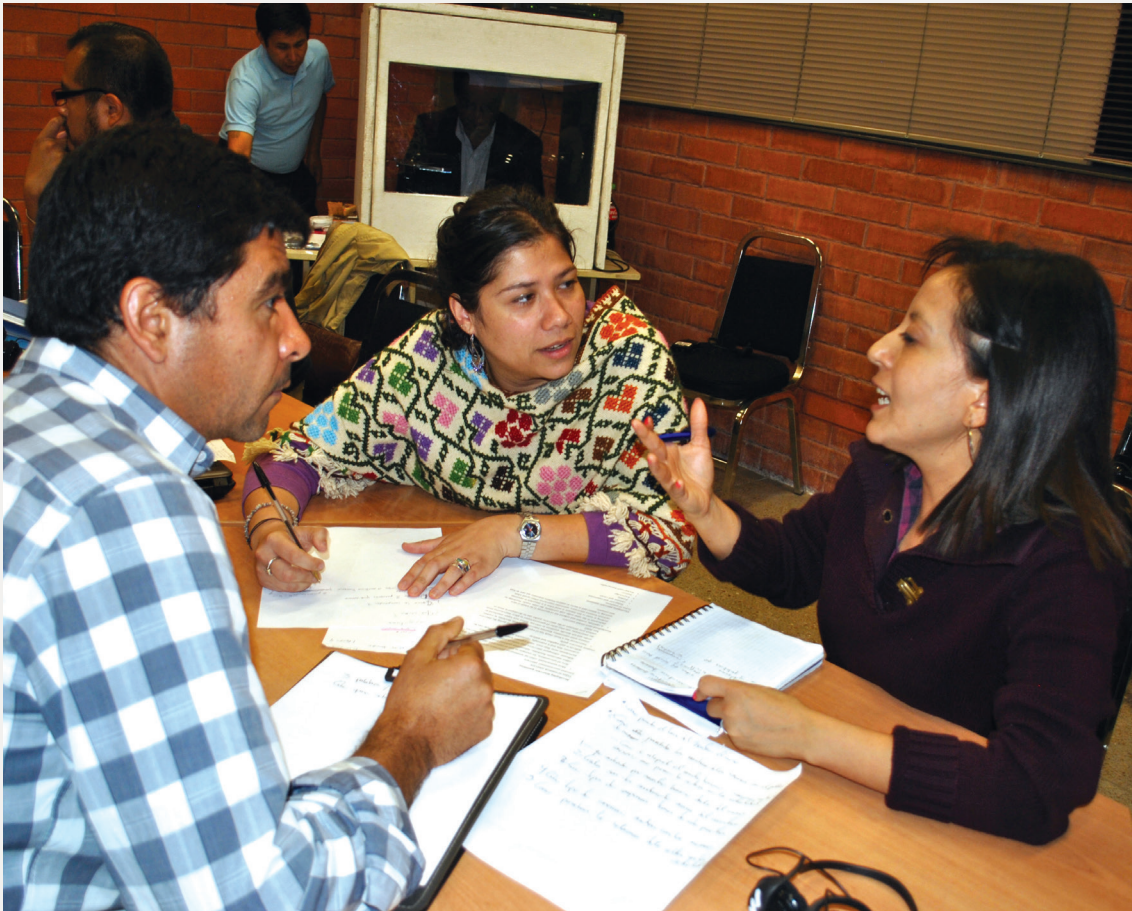
► Figura 3. Sistematización de las entrevistas.