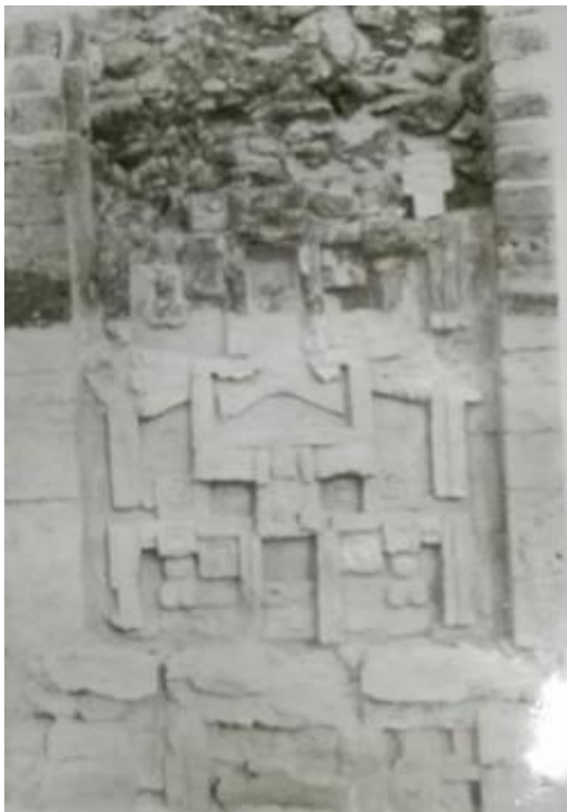
Figura 4.- Fondo Román Piña Chan. Informe final de las exploraciones en Xpuhil, Becán, Campeche. Clasificación: 40 -137

El Fondo lo conforman ocho tomos, en los que se puede consultar información sobre estados como Yucatán, Chiapas, Campeche, Estado de México, Veracruz, Tabasco, Quintana Roo, Coahuila y Sonora. Entre las temáticas de investigación por el Dr. Piña Chan, se encuentran importantes referencias sobre Yaxchilán, el Museo de Dzibilchaltun, el sitio El Hormiguero, el Calendario maya, entre otros. Contiene informes, ensayos, proyectos, resúmenes, interpretación de actividades y anteproyectos, que van desde 1948 hasta el año 2000.