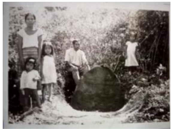
8.- Lápida localizada en la región del Soconusco, Chis. Fondo Monumentos Prehispánicos. Izapa, Cacahotán, Soconusco Estado de Chiapas. Clasificación: Tomo VI.