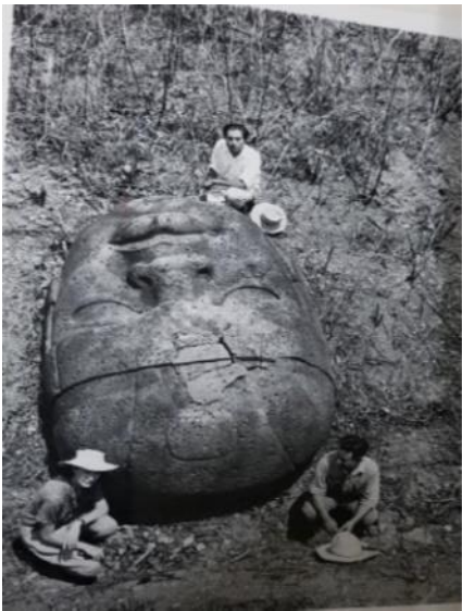
Figura 9.- Fondo de Monumentos Prehispánicos. Foto #48149.- San Lorenzo, Tabasco. De Stirling, Mathew. Clasificación: 1312-31.