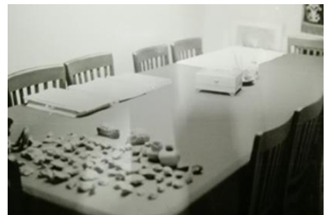
Figura 2.- Fondo Florencia Müller. Imagen tomada del texto "Cómo hacerse experto en cerámica prehispánica en diez lecciones". Clasificación 36-58.

El acervo histórico de este Fondo está conformado por nueve tomos, donde el lector podrá encontrar información sobre Tulancingo, Tlaxcala, cerro de la Campana, Teotihuacán, Cuicuilco, la región Huasteca, Comalcalco, Morelos, Zacatecas, Cholula, Xochicalco, Michoacán, Chimalacatlán, Chiapa "El Viejo", Guerrero, Cualác, Huapalcalco y Salamanca. Resguarda información de su trabajo en campo, borradores, notas periodísticas y descripciones de cerámica.