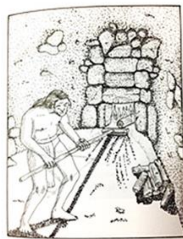
Figura 6.- Fondo Enrique Nalda, Clasificación: 43-280

En este Fondo se encuentran catálogos, cédulas, notas, diarios de campo, proyectos, informes, dibujos, artículos, tesis y planos. Los resultados de casi 25 años de exploraciones están resguardados en este Fondo. Es pertinente resaltar que en conjunto con el arqueólogo Javier López Camacho creó el Atlas Arqueológico Nacional . El Fondo Enrique Nalda contiene 94 tomos y abarca de los años 1937 a 2009.