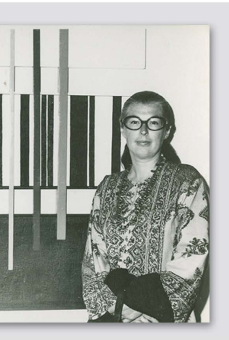
obra en el Museo Nacional de las Culturas, 1971