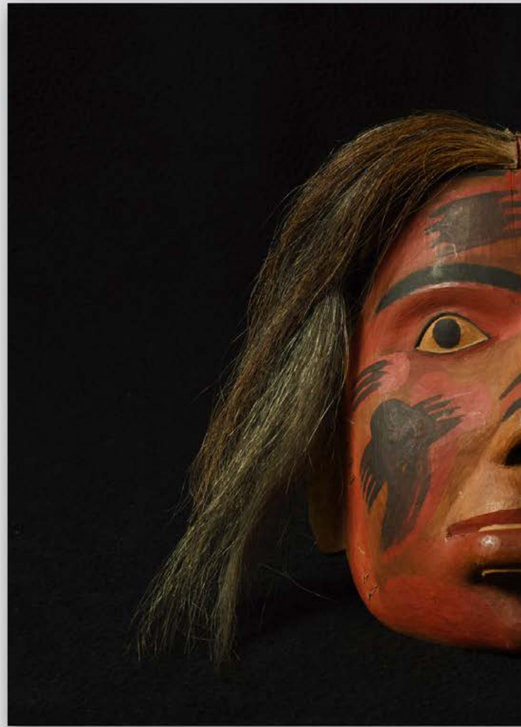
Máscara tallada en madera con aplicación de pintura