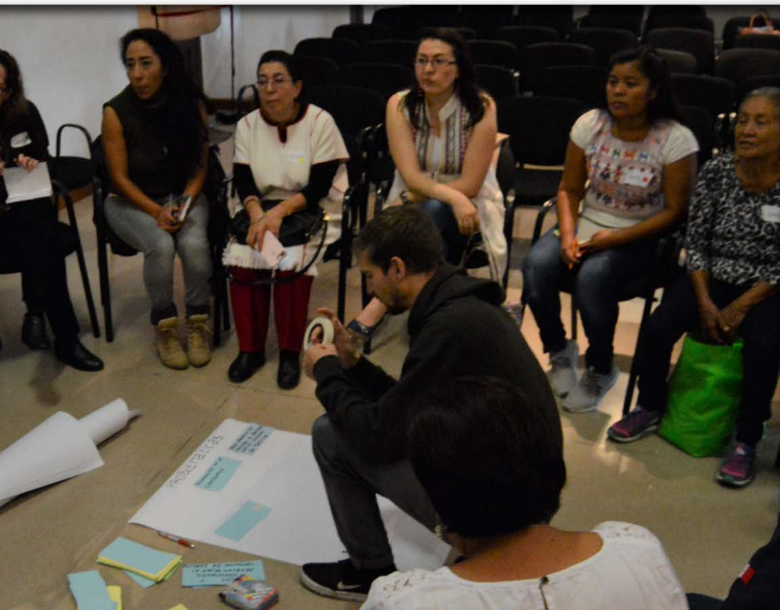
Aspecto de una mesa de trabajo en el Foro por la Buena tortilla .

fomentar el cooperativismo y el trabajo colectivo transversal entre academia, industria y gobierno. Familias campesinas, agricultores, productores de tortilla, transformadores y consumidores se verán beneficiados de mecanismos que diferencien una buena tortilla, producida con maíces nativos, nixtamalizados y libres de transgénicos, agrotóxicos y aditivos”.