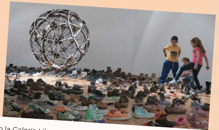
Fotografías de la instalación Los zapatos sirios , en la Galería Libertad, Querétaro, marzo de 2018.

La migración y sus nuevas expresiones, son un fenómeno que nos inquieta y sobre el que, en el Museo, comenzaremos a reflexionar desde la antropología; para ello, vamos albergar del 6 al 8 de noviembre el Coloquio El impacto de las migraciones en el mundo globalizado . Para su realización hemos trabajado con la Dirección de Etnología y Antropología Social, el Seminario Permanente de Estudios Chicanos (DEAS-INAH) y el Grupo de Trabajo Fronteras, Regionalización y Globalización en América (CLACSO).