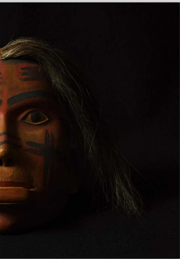
e pelo de caballo, Cultura Tsimshian, Canada