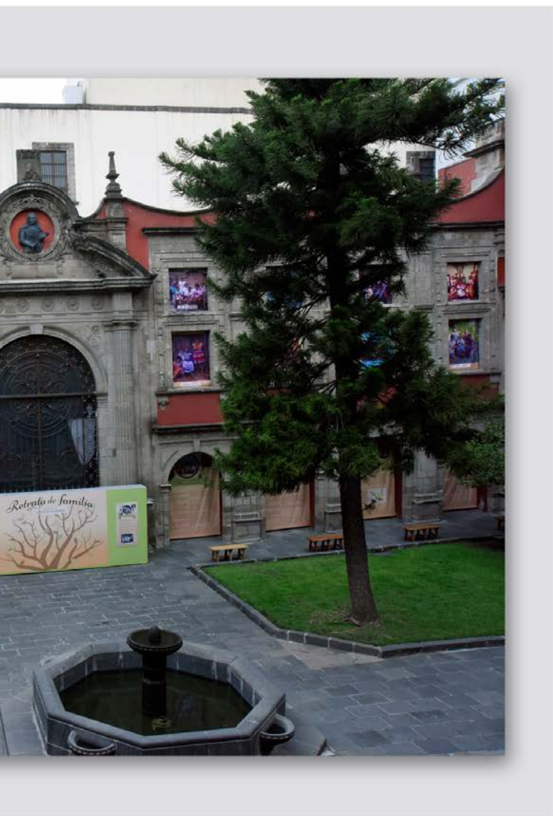
Lourdes Almeida, fachada interior del MNCM