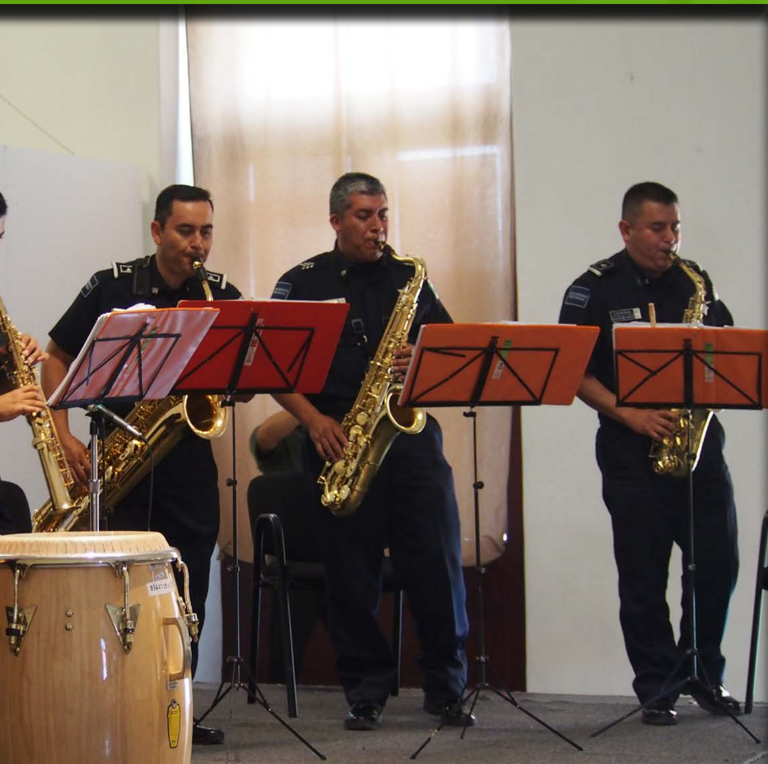
Ensamble de saxofones de la Policía Federal.