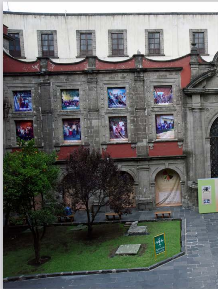
Exposición fotográfica “Retrato de familia” de