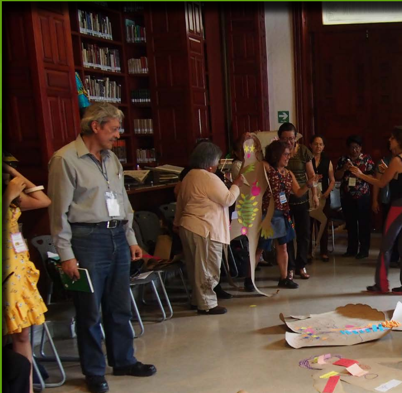
Aspecto del Diplomado de “Narradores orales espe Foto

sus obras e intercambiar sus productos con el público y con otros artistas. La idea es que la gente venga e intercambie algún objeto con los productos que traen los expositores, fortaleciendo esta cultura del trueque que es fundamental para ellos”, explicó.