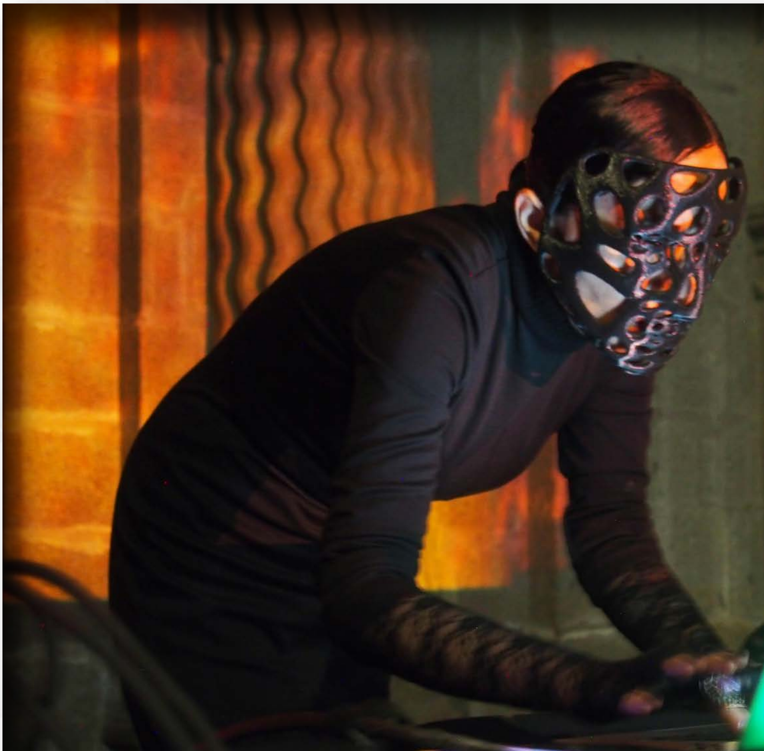
Artista Magenta en su set In umbra , clausura del Festival HW

“me interesa justamente el cruce de lo orgánico, sacarlo completamente de donde es y alojarlo en otro espacio. En mi pieza, esto se pone de manifiesto en la utilización de un hongo, que va descomponiendo, corrompiendo, los datos como un virus”.