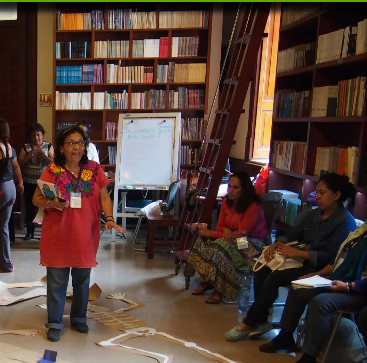
especializados en el trabajo para niños y adolescentes”. : JLB

“La devoradora”, de “El coyote”, o bien, el pequeño libro ilustrado “Diablo”, de Chacho Grijalba.