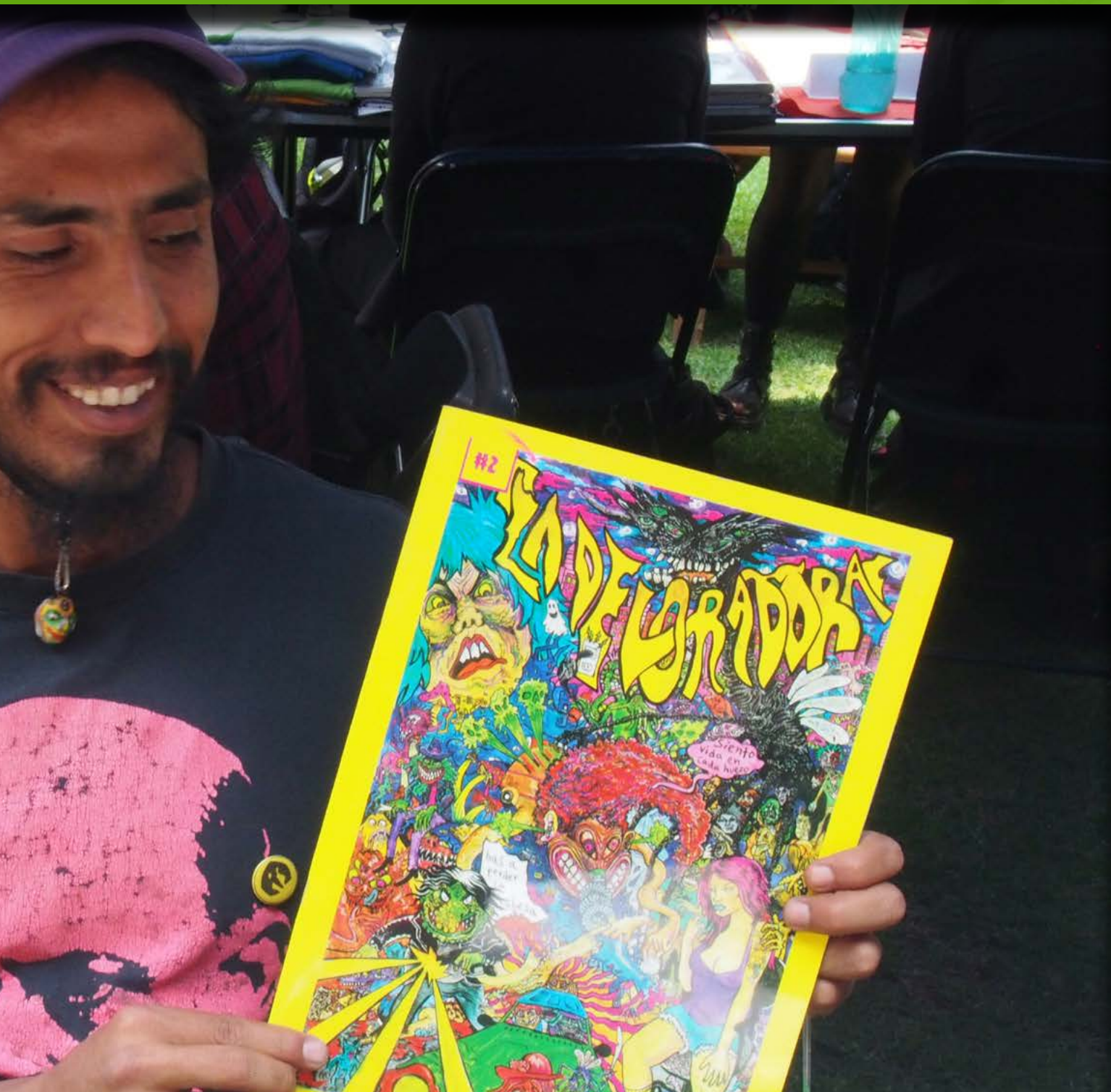
...e, muestra su obra en el Festival de memoria, gráfica y fanzine.