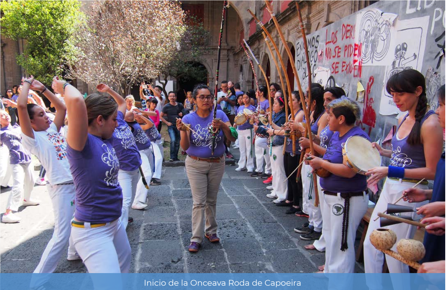
Inicio de la Onceava Roda de Capoeira

E l domingo 3 de marzo, las actividades del Museo Nacional de las Culturas del Mundo abrieron con los sonidos del tambor de mano, tambor, pandeiro y el berimbau que acompañaron a la Onceava Roda de Capoeira. Fue organizada por el colectivo Capoeira Longe do Mar y dedicada a la mujer capoeirista, en el marco del Día Internacional de la Mujer.