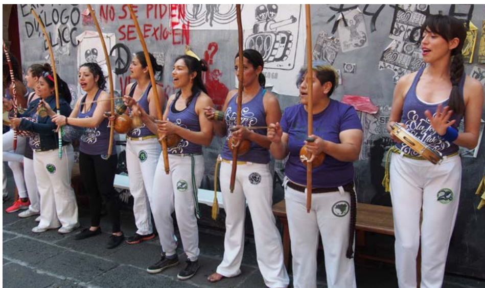
En el jogo de la roda de capoeira