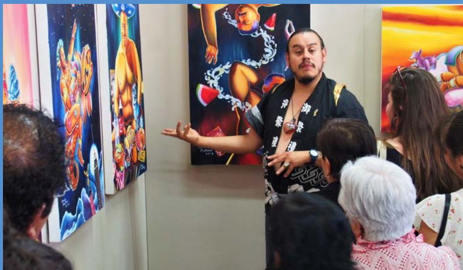
Visita guiada a la exposición Sueños México-Japón. Óleos y litografías de Claudio Castillero

La exposición “Sueños México-Japón. Óleos y litografías de Claudio Castillero”, se llevó a cabo en colaboración con la Fundación Japón, la Embajada de Japón en México, en el marco del 130 aniversario de las relaciones diplomáticas México-Japón.