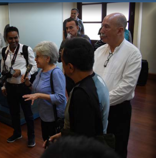
ante el recorrido por su exposición