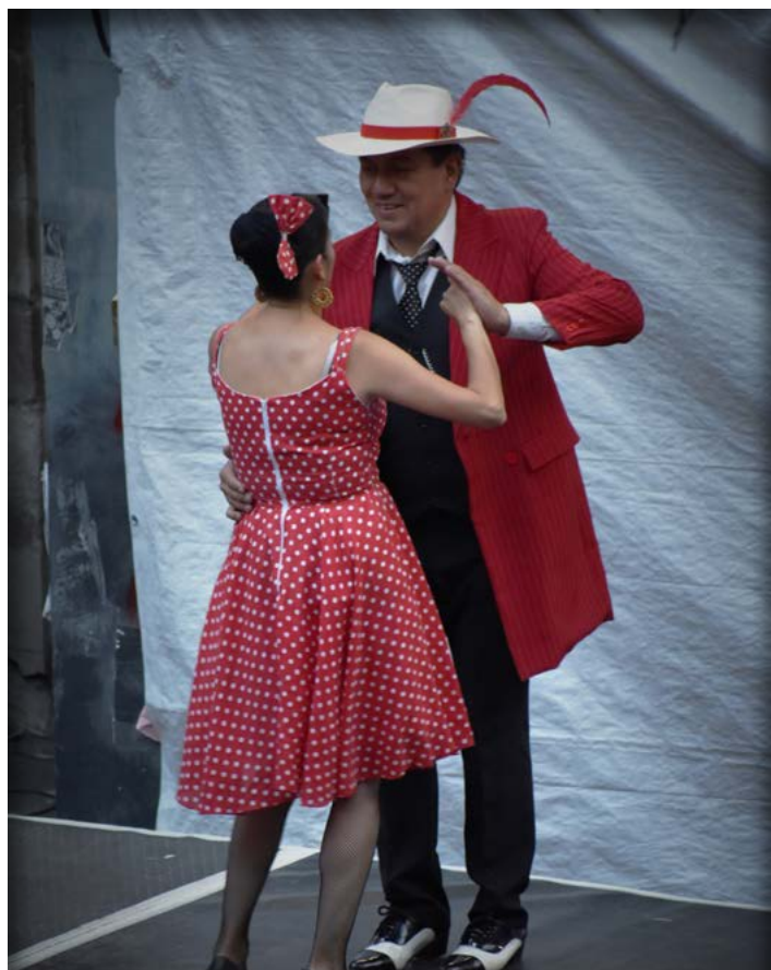
Pareja de danzón en la Noche de Museos Pachucos y lentejuela

Después, apareció un personaje muy peculiar, de gran carisma, que antes de su participación había estado tras bambalinas ayudando en la producción musical del evento; nos referimos a