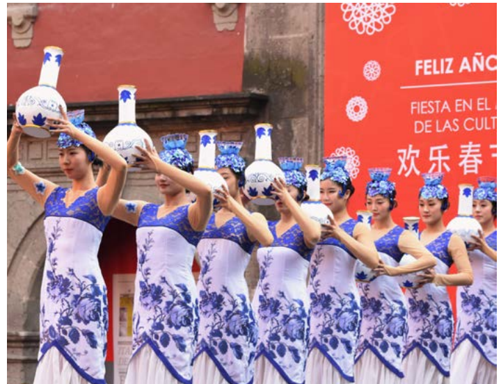
Ensamble de Canto y Danza de la ciudad de Nanchang, China.

Acto seguido, los miembros de la Fundación Cultural China de Kung Fu,