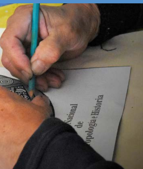
Origen e historia del Museo Nacional de las Culturas del Mundo.