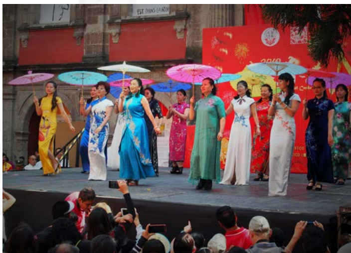
Danza de Las sombrillas, Grupo Artista de Huaxing.