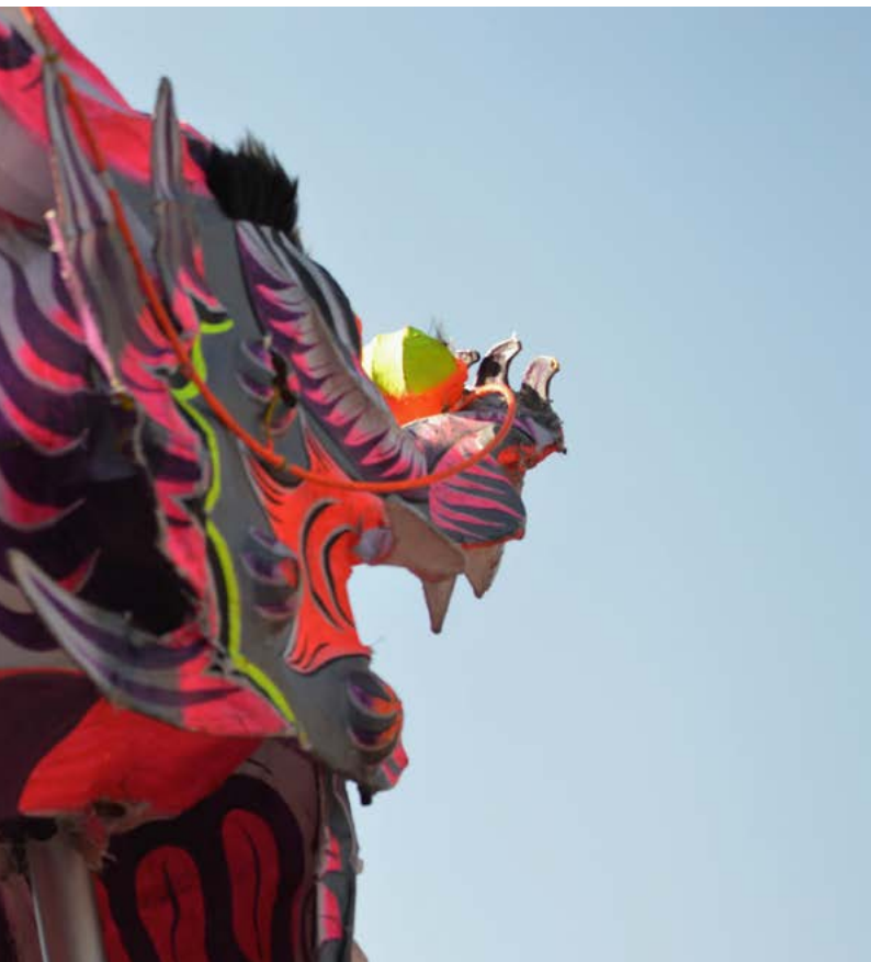
de Año Nuevo chino.