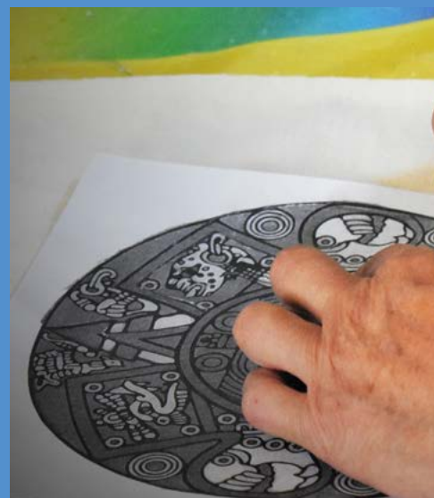
Aspecto del Taller Origen e historia del INAH en las Culturas del Mundo