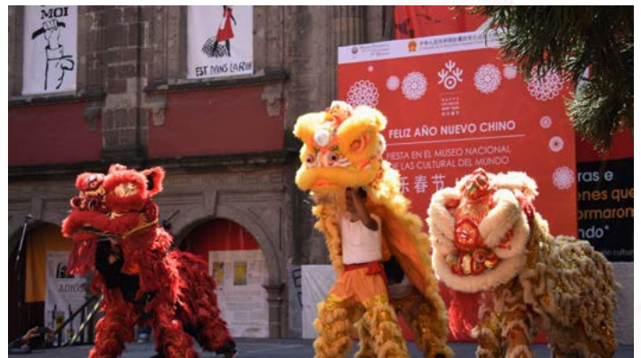
Danza del león, Fundación Cultural China de Kung Fu, A.C.

Al finalizar su presentación, los miembros del grupo de Nanchang regalaron al público unos muñecos de cerditos rojos, que fueron repartidos entre algunos afortunados visitantes.