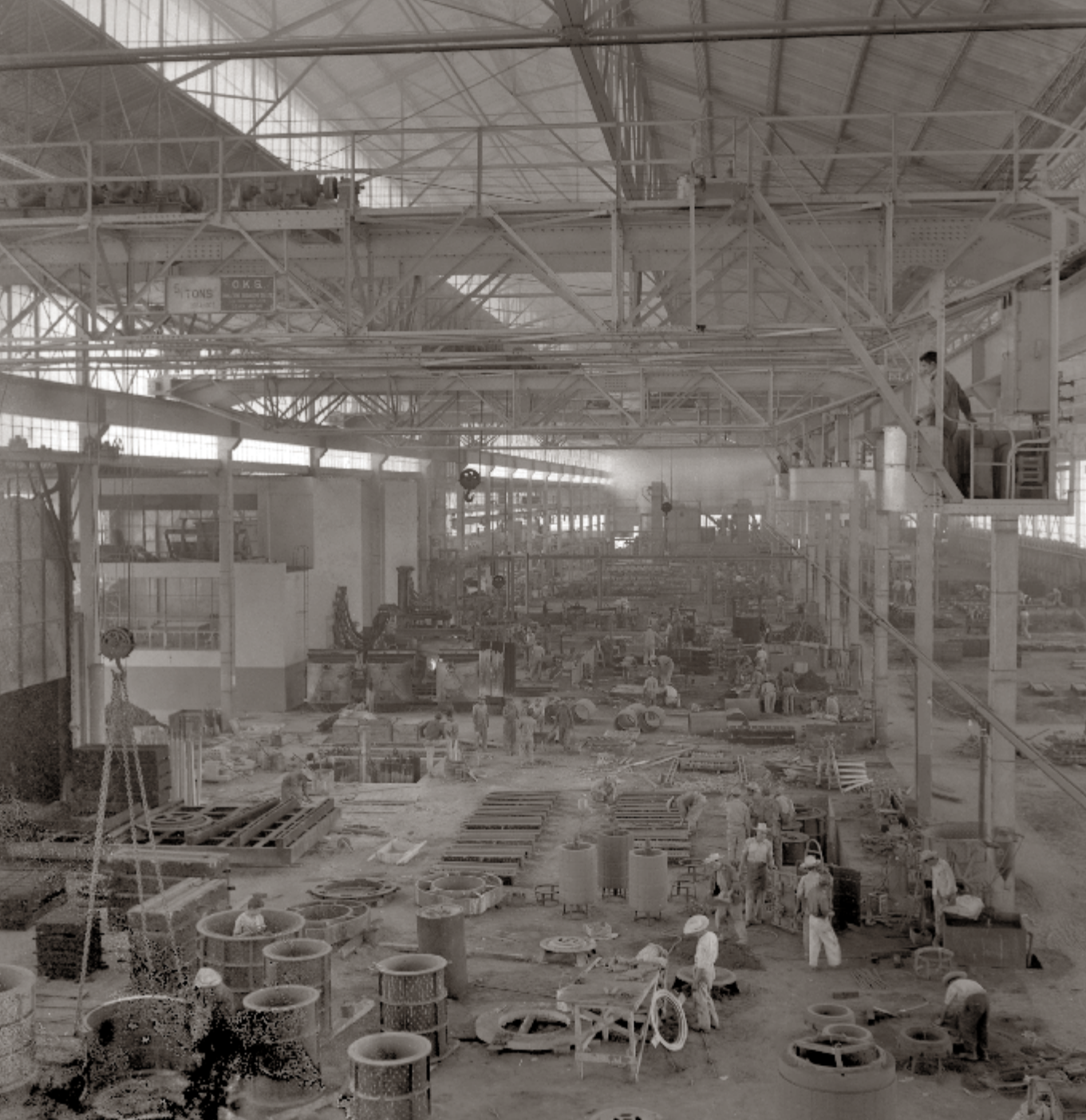
© 843857 Bonifacio Maraveles Fondo Bonifacio Maraveles, Horas laborales en una fábrica , ca. 1956. SECRETARÍA DE CULTURA. INAH.SINAFO.FN.MX