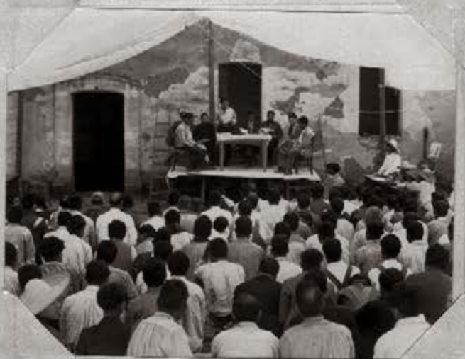
4.- Los mismos concurrentes el día de la Conferencia en Chipiltepec, Méx.