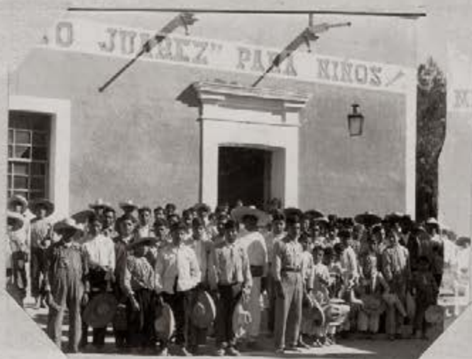
5.- Alumnos de la misma Escuela Libre de Agricultura "Emiliano Zapata", Chiconcuac, México.