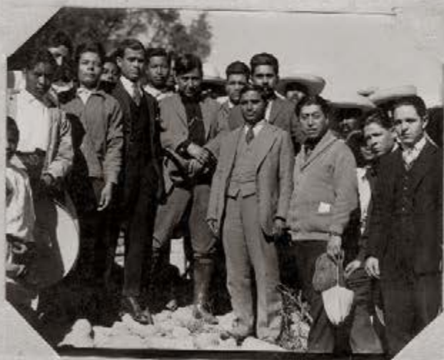
2.- Director, Profesores y demás personal de la Escuela Libre de Agricultura "Emiliano Zapata", Chiconcuac, México, y Presidente de la Liga Nacional de Comunidades Agrarias. 2420