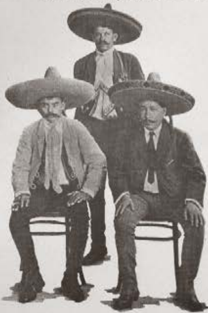
El Apóstol Zapata; a su lado el General Palafox y de pie Amador Zalazar en Cuernavaca en 1914, conferenciando sobre la campaña contra Victoriano Huerta.

¿Cual de los otros Candidatos puede presentarse así a los Campesinos?