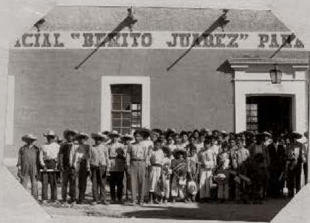
6.- Secretario y alumnos de la Escuela L. de Agricultura "Emiliano Zapata". El primero al centro del grupo.