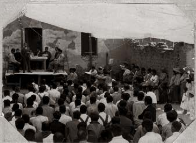
3.- Otro aspecto de la reunión en día de la Conferencia en Chipiltepec, Méx.