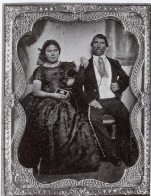
Anónimo, Sin título , ambrotipo coloreado, ca. 1860. Col. Museo Franz Mayer