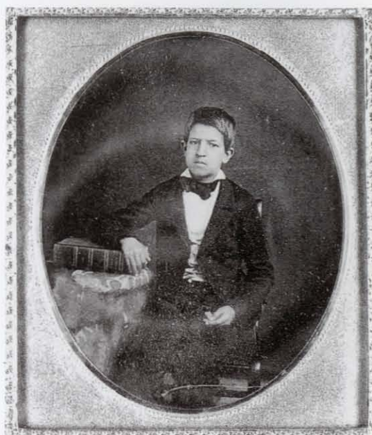
Anónimo, Sin título , daguerrotipo coloreado, ca. 1855. Col. Fototeca Antica

sintiendo quizás la feroz competencia del mercado local de daguerrotipos, Noessel había bajado sus tarifas casi a la mitad y anunciaba que su galería abría todo el día del domingo. 19 No obstante, en unas semanas, cerró su negocio y adquirió un pasaje a Veracruz. Al hacer esto, Noessel formó parte de una migración comercial, floreciente y riesgosa, que se había desarrollado entre los dos puertos del golfo. A lo largo de la primavera de 1847, los periódicos de Nueva Orleans y Veracruz estaban repletos de noticias de emprendedores estadounidenses que prosperaban en el capturado puerto como comisionistas, agentes de embarco, administradores de hoteles y cantinas, al igual que como artesanos y hombres de negocios. Si Noessel tuvo ocasión de leer los periódicos veracruzanos que las oficinas de los diarios de Nueva Orleans recibían regularmente, debió haber percibido que Veracruz estaba lleno de oportunidades para un daguerrotipista emprendedor.