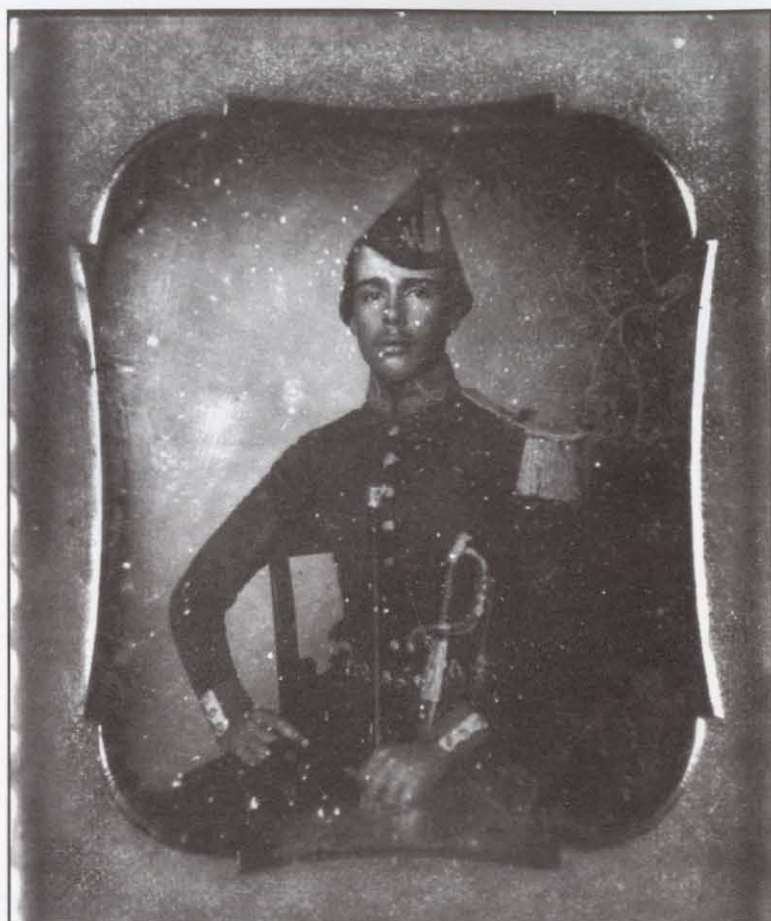
Anónimo, Cadete , daguerrotipo coloreado, ca. 1847. Col. Museo Franz Mayer