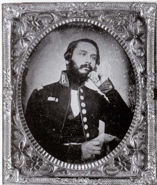
Anónimo, Sin título , daguerrotipo, ca. 1847. Col. Museo Franz Mayer