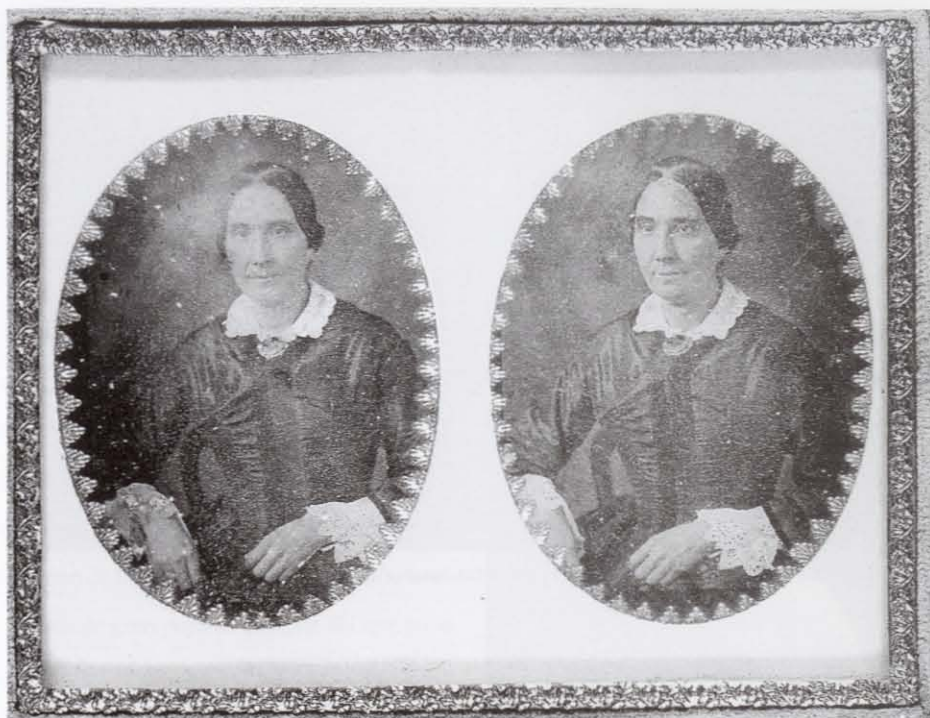
Anónimo, Sin título, daguerrotipo estereoscópico coloreado, ca. 1845.