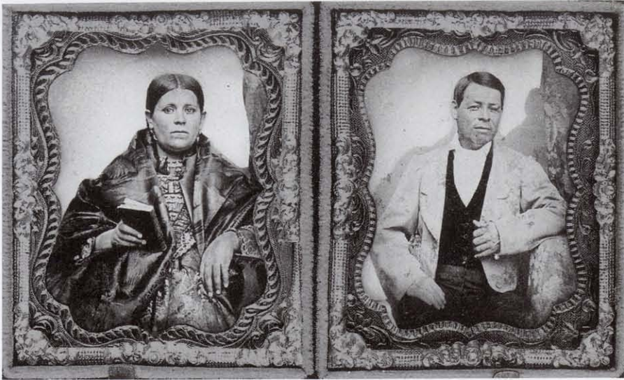
Anónimos, Sin título , ambrotipos coloreados, ca. 1860. Col. Fototeca Antica