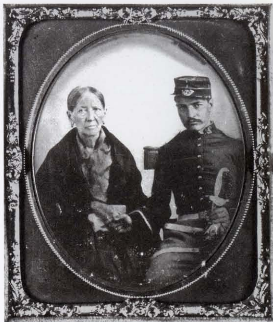
Anónimo, Sin título, daguerrotipo, ca. 1850.