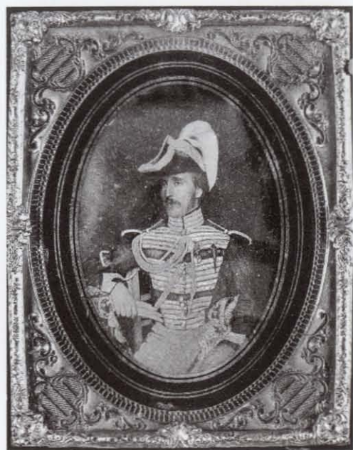
Anónimo, Sin título, daguerrotipo coloreado, ca. 1850.