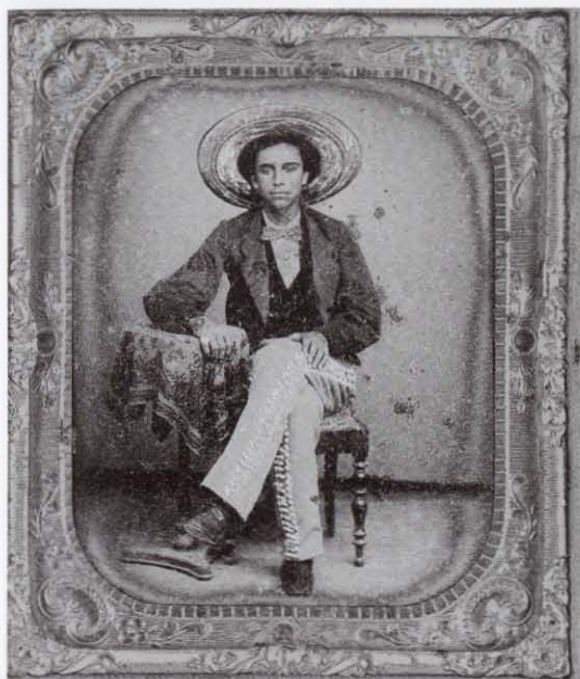
Establecimiento La Fama de los Retratos [probablemente Emilio Mangel o Juan María Balbontin], Sin título , ambrotipo coloreado, ca. 1858. Col. Fototeca Antica