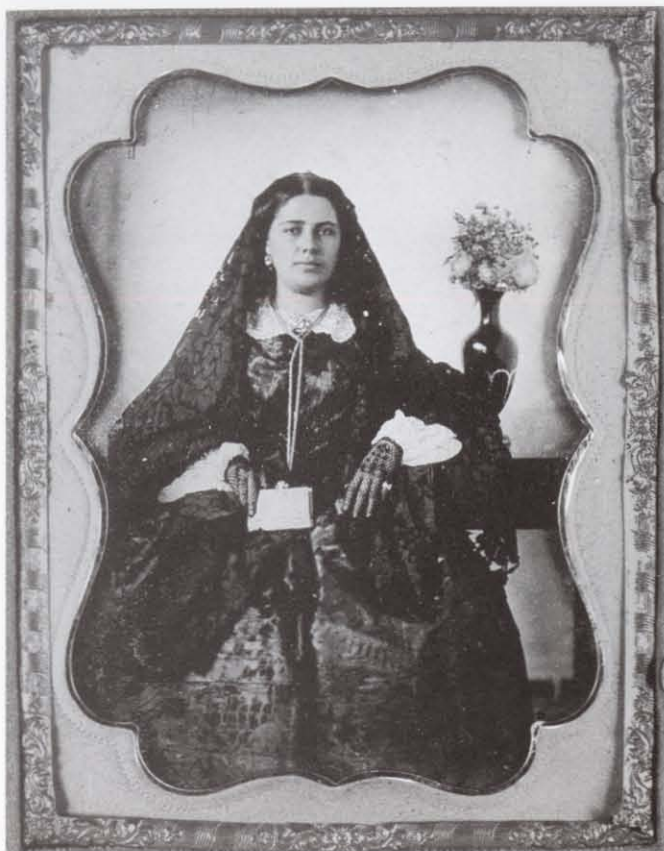
Anónimo, Sin título , ambrotipo coloreado, ca. 1860.

un lugar suficientemente respetable: el domicilio particular de la familia del señor Haas, en el número 686 de la calle Vicario.