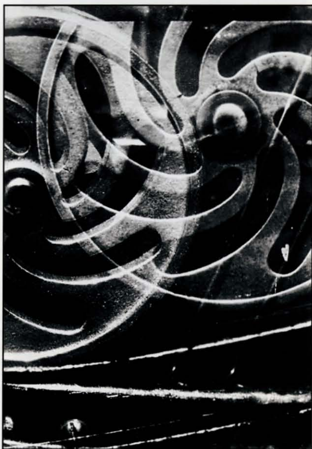
Aurora Eugenia Latapi, Sin título , ca. 1930. Col. de la autora