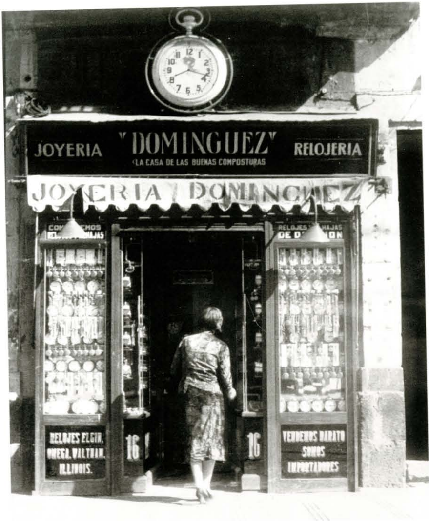
Ricas horas, ca. 1931