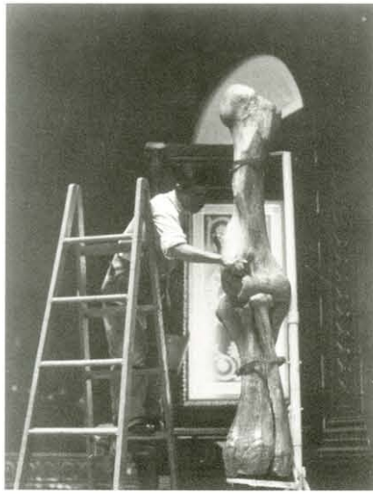
El gran hueso, ca. 1931