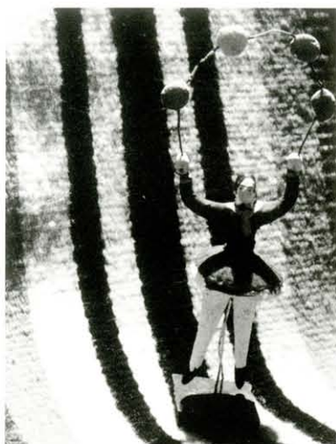
Muñequito sobre sarape, 1928