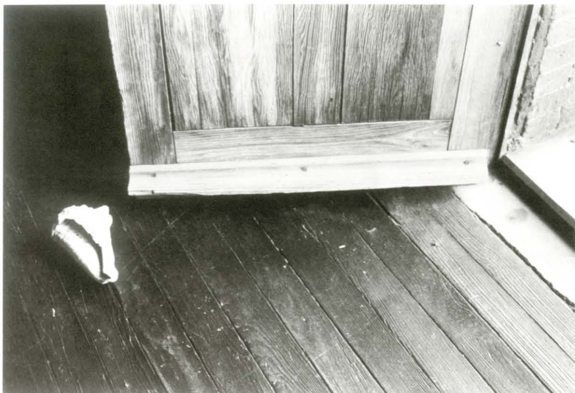
Concha en el piso, ca. 1935 Abajo: Time , Nueva York, 24 de febrero de 1997. Col. biblioteca particular

proponían una nueva visualidad en la fotografía y en las artes plásticas en general; con ellos colaboró en importantes iniciativas culturales; de ellos aprendió y replanteó nuevas soluciones y propuestas.