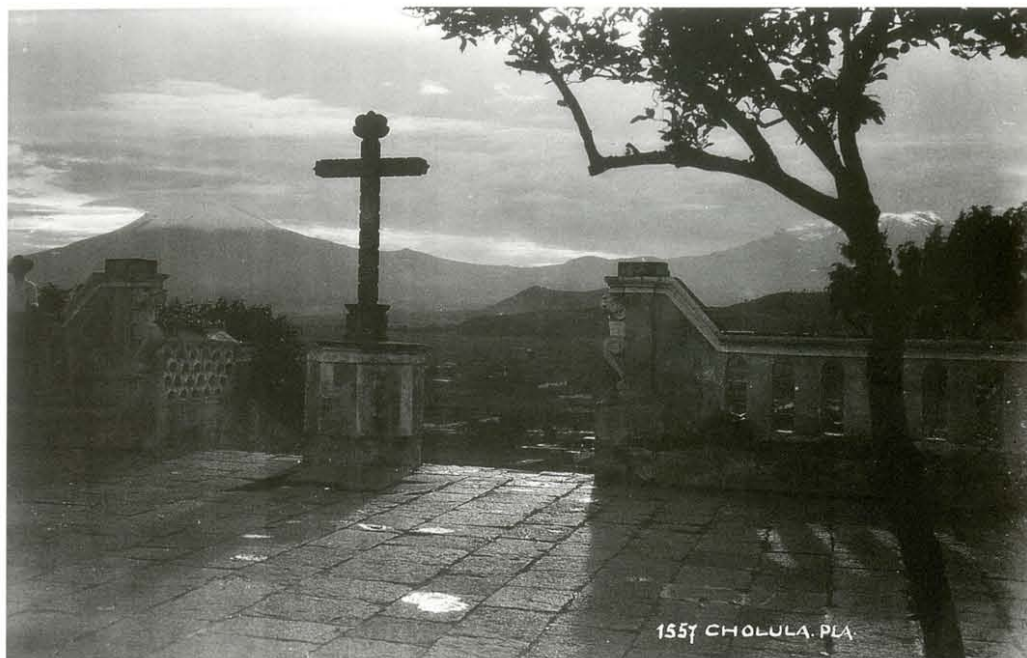
Hugo Brehme, Cholula, Puebla, ca. 1925 . Col. Sinafo-INAH núm. de inv. 373366