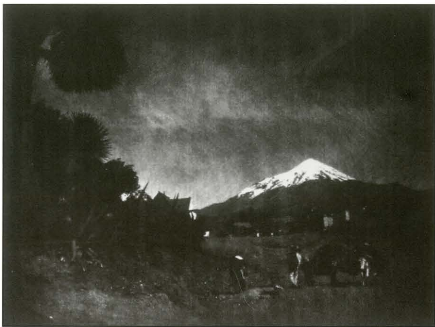
Popocatepetl, ca. 1920.