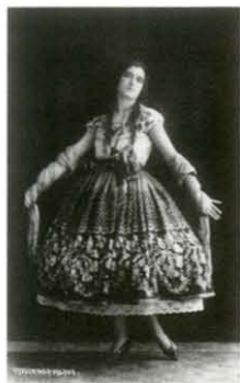
Hugo Brehme, China poblana, ca. 1925.