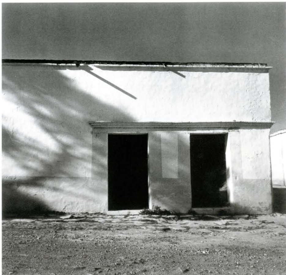
Sin título, s/f. Col. Fundación Cultural Mariana Yampolsky A.C., en adelante FCMY Abajo: La casa en la tierra , México, Instituto Nacional Indigenista, 1980. Col. particular

[Sobre la incompreensión de la fotografía en la Bienal de Artes Gráficas].