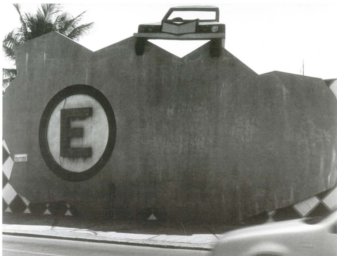
Sin título, ca. 2000. Col. fcmw