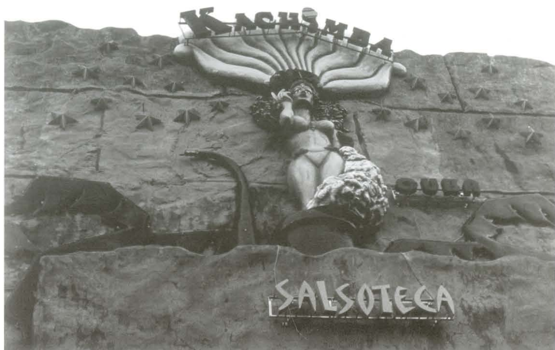
Kachimba, Veracruz, Veracruz., 2001.