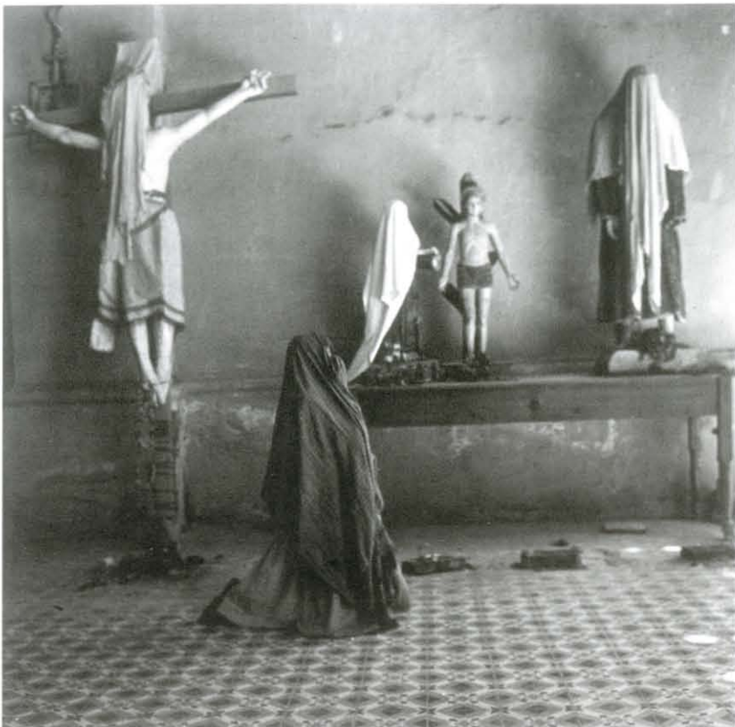
Sin título, s/f. Abajo: Mazahua, México, Gobierno del Estado de México, 1993.

No sé si mis fotografías son arte o no, y la verdad eso tiene poca importancia, lo esencial para mí es tener la oportunidad de expresarme y hablar y mostrar lo que quiero decir a través de mis imágenes.