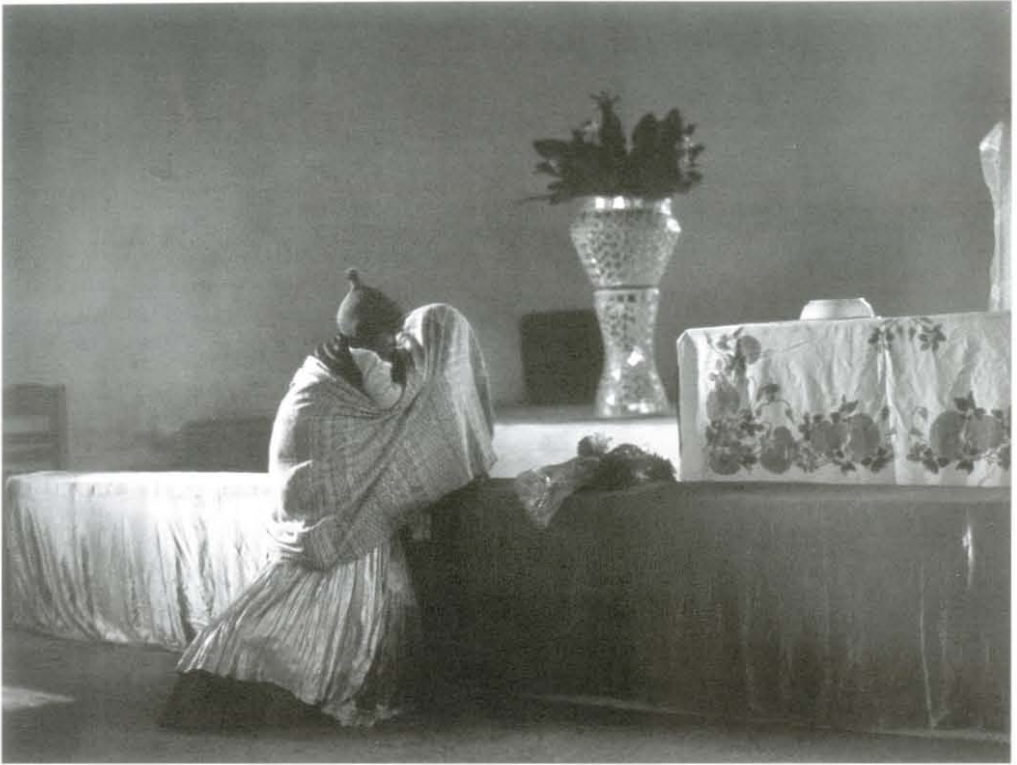
Plegaria, Loma de Juárez, ca. 1990.