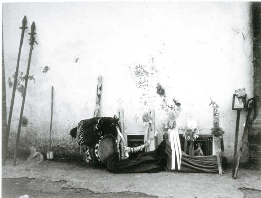
Sin título, s/f. Col. rcmv Abajo: Escala , núm. 65, año V, México, diciembre de 1994. Col. particular

éste se refiere al montaje de las fotografías, cuya responsabilidad recayó en David Maawad y un equipo de conservadores de la Fototeca del INAH de Pachuca.