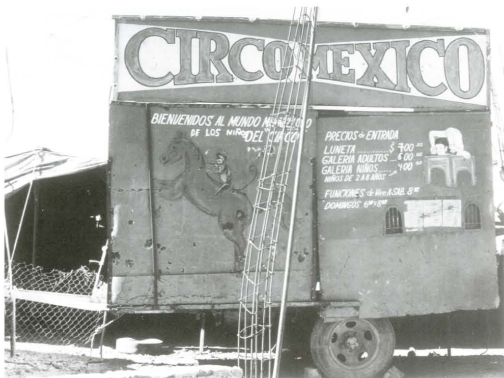
Sin título, s/f. Col. rcmy