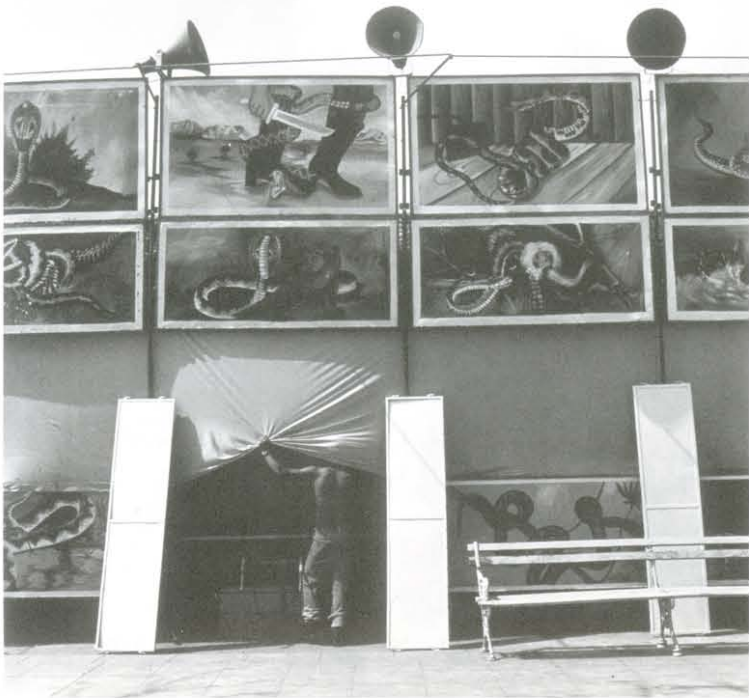
Sin título, s/f. Col. FCMY

Abajo: Reflex , núm. 26, año V, México, septiembre-octubre de 2000. Col. Elsa Escamilla