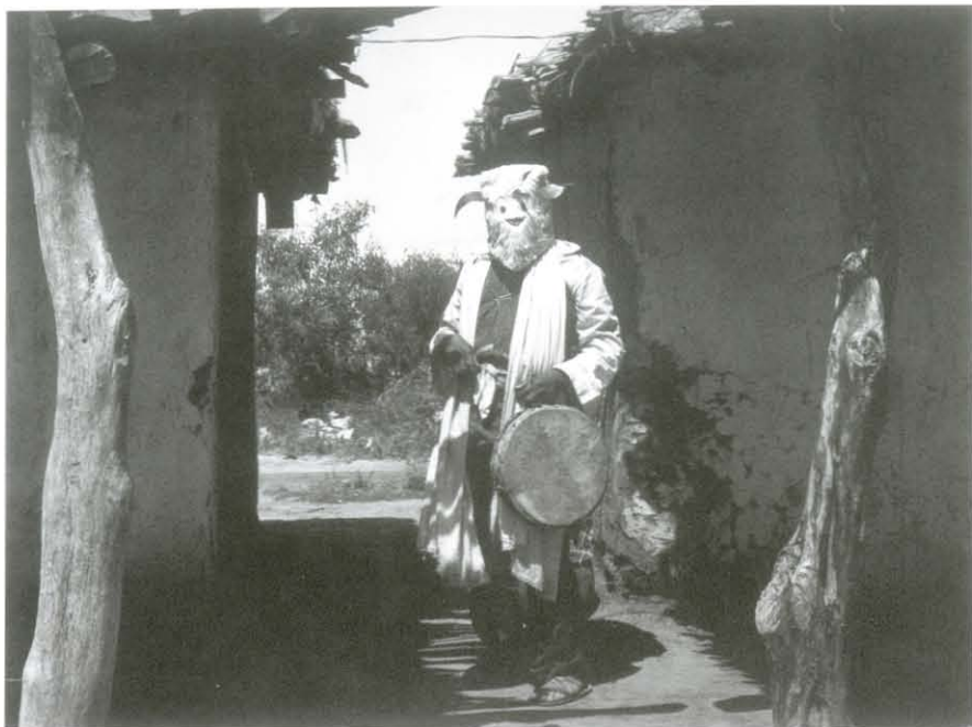
Sin título, s/f. Abajo: Signs, Journal of Women in Culture and Society, núm. 1, vol. 27, Washington, D. C., otoño de 2001.