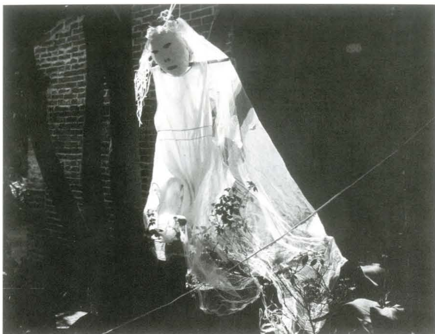
Fantasma, Oaxaca, s/f. Col. rcmv

pasado y cobran un interés, histórico tal vez, no tanto plástico. No hay manera de saberlo. Quien está en la cima de la montaña en un momento, puede estar en el fondo del mar dos horas después [...].