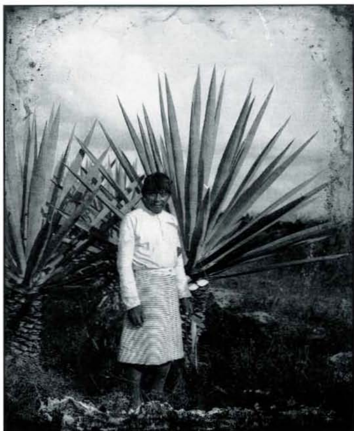
PGJ, sin título , ca. 1920.