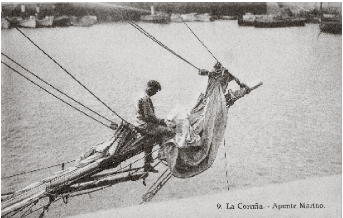
470 La Coruña. Apunte marino , La Coruña, Galicia, s. f., Colección de postales de la Biblioteca Francisco Xavier Clavigero. El mar, la pesca y las playas son una temática de las postales de don Fernando, tanto en las de México como en las de España.