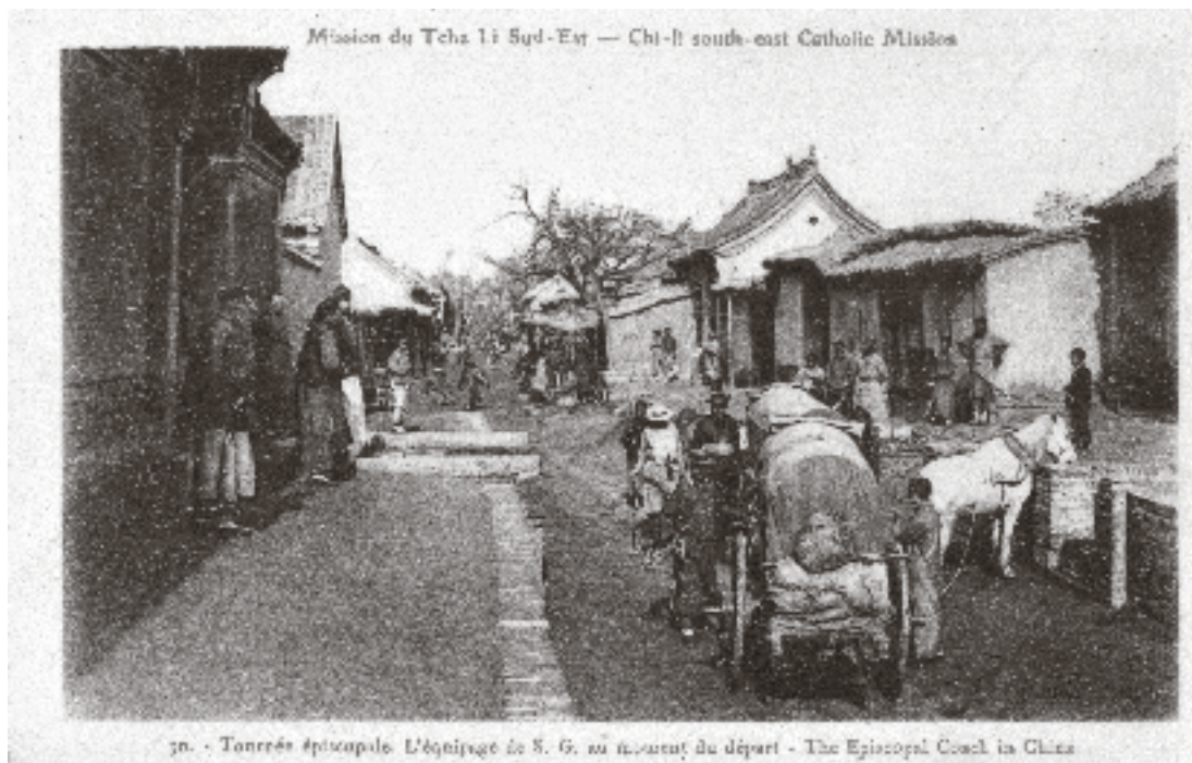
3421 Misión jesuita de Tche Li en China, China, s. f.

los jesuitas suelen viajar por varias partes del mundo o del país. Por medio de la correspondencia mantienen contacto con sus hermanos jesuitas, provinciales, alumnos y familiares, y en ella encontramos una buena cantidad de postales. Este conjunto de tarjetas no tiene una temática especial ni predilección por un país ni un autor, sino que está formado por aquellos ejemplares que sus propietarios recibieron o bien por aquellos que juntaron porque el tema les pareció importante, interesante y digno de compartir.