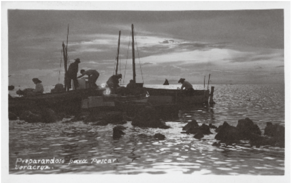
1737 Preparándose para pescar, Veracruz , s. f.