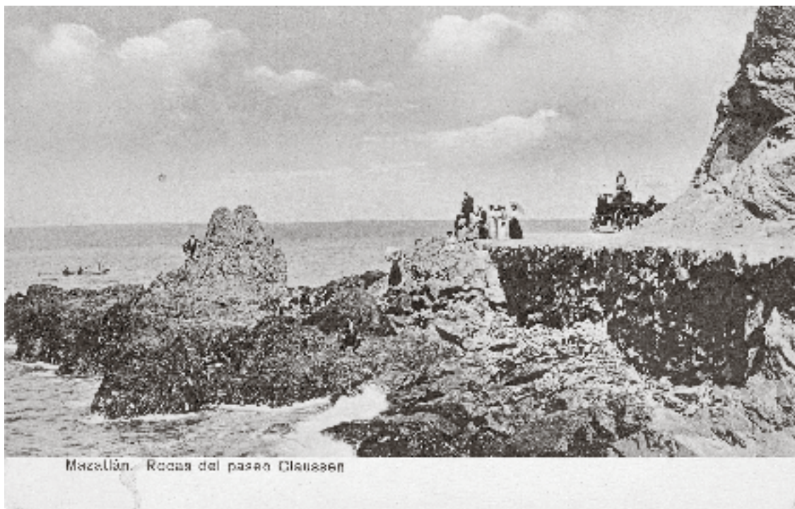
461A Mazatlán, Rocas del paseo Claussen , Mazatlán, s. f., Colección de Postales Pérez Alonso, Biblioteca Francisco Xavier Clavigero. Paseos y costumbres de entretenimiento se ven reflejadas en las postales.