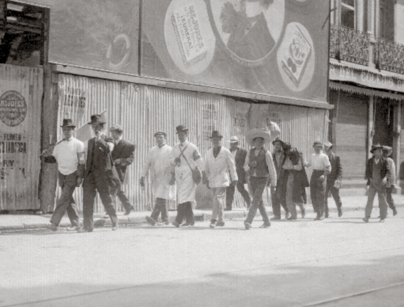
76 Contingente médico de la Cruz Blanca, México, 1913, Colección de Postales de la Decena Trágica, Biblioteca Francisco Xavier Clavigero.

nocido como la Decena Trágica, son las únicas que tienen un tema concreto y que llegaron agrupadas en un álbum bajo ese nombre. 12 Las 102 postales que lo integran —cinco de ellas no son sobre el acontecimiento, aunque sí están de alguna manera relacionadas con él, pues su tema es Francisco I. Madero como presidente de México— fueron tomadas por varios fotógrafos, y sólo ocho de ellos han sido identificados. 13