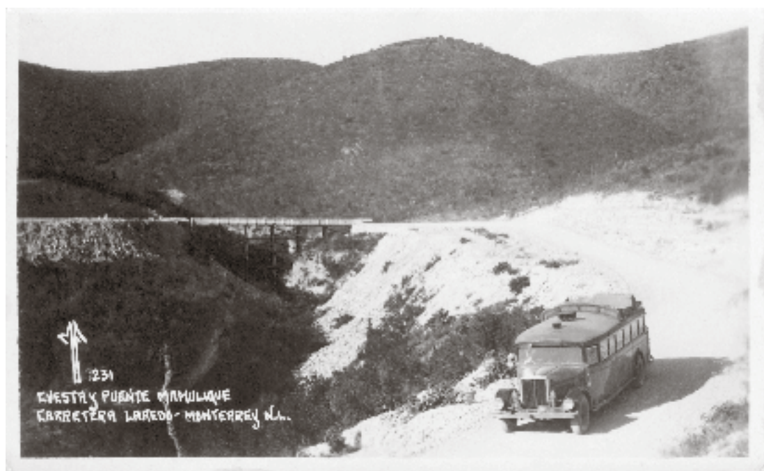
649 México Fotográfico. Cuesta y cumbre Mamulique , Monterrey, 1937, Colección de Postales Pérez Alonso, Biblioteca Francisco Xavier Clavigero.