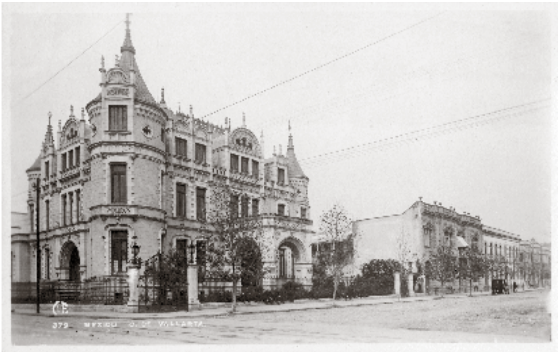
2323 México. C. Vallarta, Compañía Industrial Fotográfica, Vallarta, s. f., Colección de postales de la Biblioteca Francisco Xavier Clavigero.