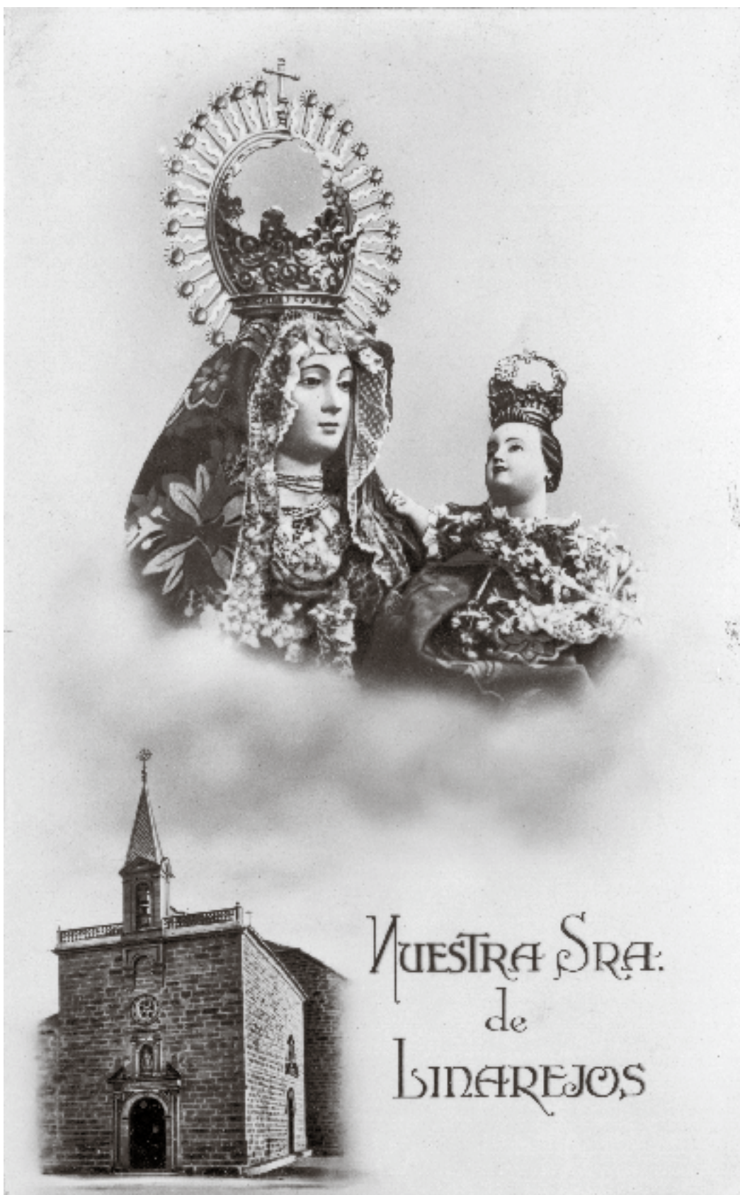
484 Santuario e imagen de la Virgen de Linares, Linares, s. f., Colección de postales de la Biblioteca Francisco Xavier Clavigero. Acompañada de un texto de felicitación por el día de su santo. Firmada: Madre.