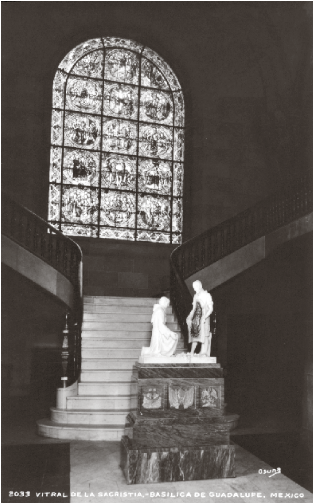
2033 VITRAL DE LA SACRISTIA.-BASILICA DE GUADALUPE. MEXICO

72 Vitrail de la Sacristia. Basilica de Guadalupe, México, s. f., Colección de Postales Pérez Alonso, Biblioteca Francisco Xavier Clavigero. Sin texto en la parte posterior. En la colección hay más de 40 postales sobre la Basílica.