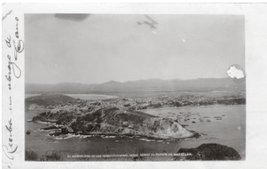
29 El aeroplano de los constitucionalistas sobre el Puerto de Mazatlán, Sinaloa, ca. 1915-1920, La mayor parte de las postales sobre aviación no tienen identificado al autor.