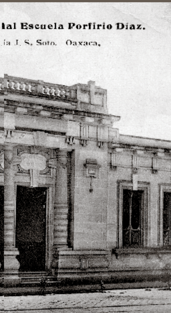
9L. Casa donde nació el Sr. General Díaz. Actual Escuela Porfirio Díaz, Oaxaca, s. f., Colección Porfirio Díaz, Fondo Fotográfico, Biblioteca Francisco Xavier Clavigero.

Dentro de la Colección Porfirio Díaz, fondo documental que contiene la correspondencia recibida por Díaz entre 1876 y 1911, existen algunas postales que fueron utilizadas por sus emisores para comunicarse con el presidente de la República.