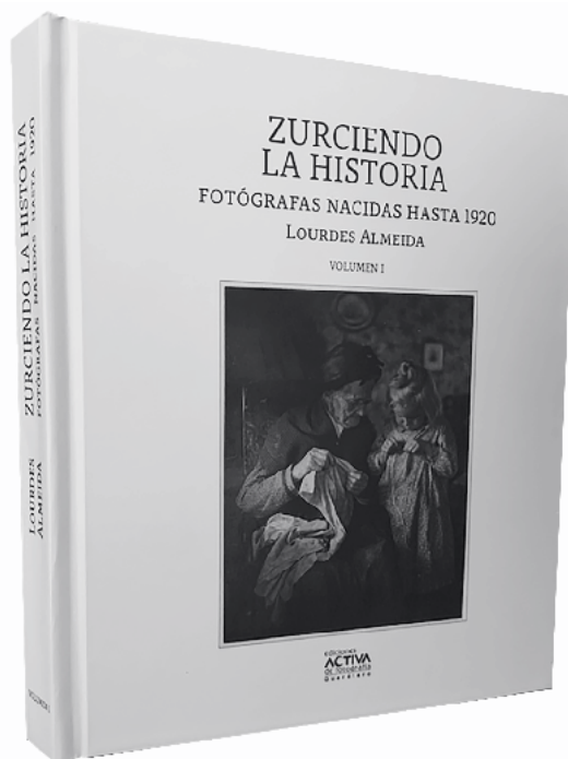
Lourdes Almeida, Zurciendo la historia. Fotógrafas nacidas hasta 1920. Volumen 1 . (México: Ediciones Activa de Fotografía, 2023), 383 pp.

El libro cuenta además con un texto de Rebeca Monroy Nasr que da cuenta de las inquietudes de Almeida en la fotografía y un breve panorama de las historias sobre mujeres mexicanas; le sigue la