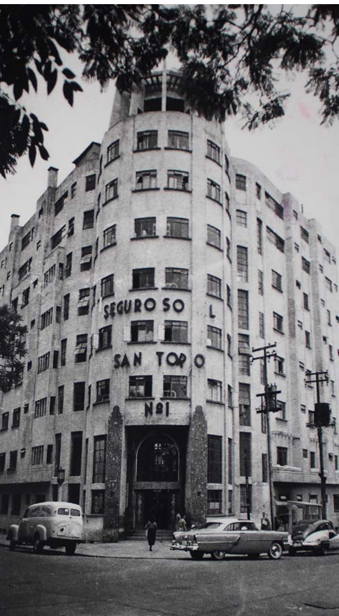
El Sanatorio Número 1, ubicado en la confluencia de las avenidas México y Michoacán, Ciudad de México, México, ca. 1940.

Hablar acerca del Instituto Mexicano del Seguro Social (IMSS) , a 81 años de su fundación, no siempre es sencillo, más aun considerando la enorme tarea de proporcionar servicios integrales de salud y bienestar a sus derechohabientes, en una población tan grande como es la de México. La mejor forma de hacerlo, sin duda, es a través de las fotografías que se han recopilado a lo largo del tiempo y que nos dan la mejor muestra del quehacer institucional visto desde su forma más íntima. En las imágenes de nuestro archivo se resguardan historias de esfuerzo, dedicación y vocación de servicio; es decir, historias que se forman con el trabajo cotidiano y arduo de su personal.