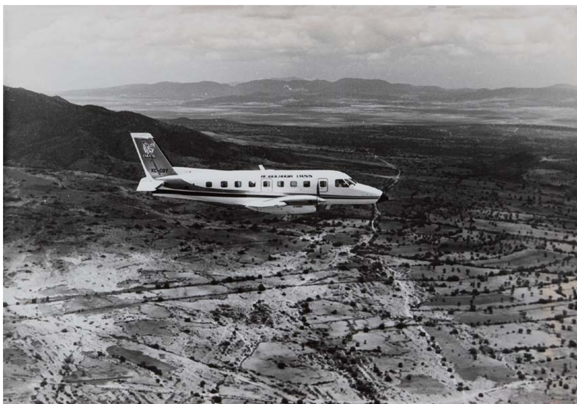
Ambulancia aérea XC-COY, ca. 1980.