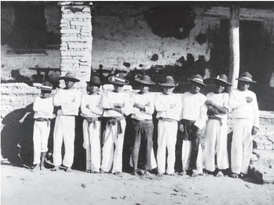
Charles B. Lang o Bedros Tartarian, Zapotecas, San Bartolo, Oaxaca, 1899