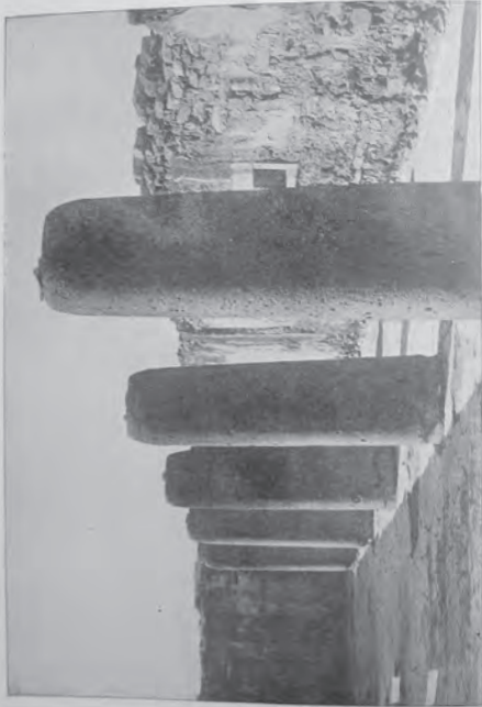
HALL OF THE MONOLITHS.

Monterey is a much Americanized city, with its great smelters, factories and breweries, but it is Mexican withal, and is a most delightful first-view town across the border. Monterey is at the crossing of the Mexican National and the Monterey division of the Mexican Central and the terminus of a branch of the Mexican International that connects with the main line at Reata; Monterey is the capital of the State of Nuevo Leon, and is distant from the City