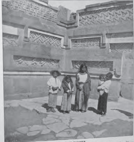
THE AUDIENCE CHAMBER.

Monterey is a much Americanized city, with its great smelters, factories and breweries, but it is Mexican withal, and is a most delightful first-view town across the border. Monterey is at the crossing of the Mexican National and the Monterey division of the Mexican Central and the terminus of a branch of the Mexican International that connects with the main line at Reata; Monterey is the capital of the State of Nuevo Leon, and is distant from the City