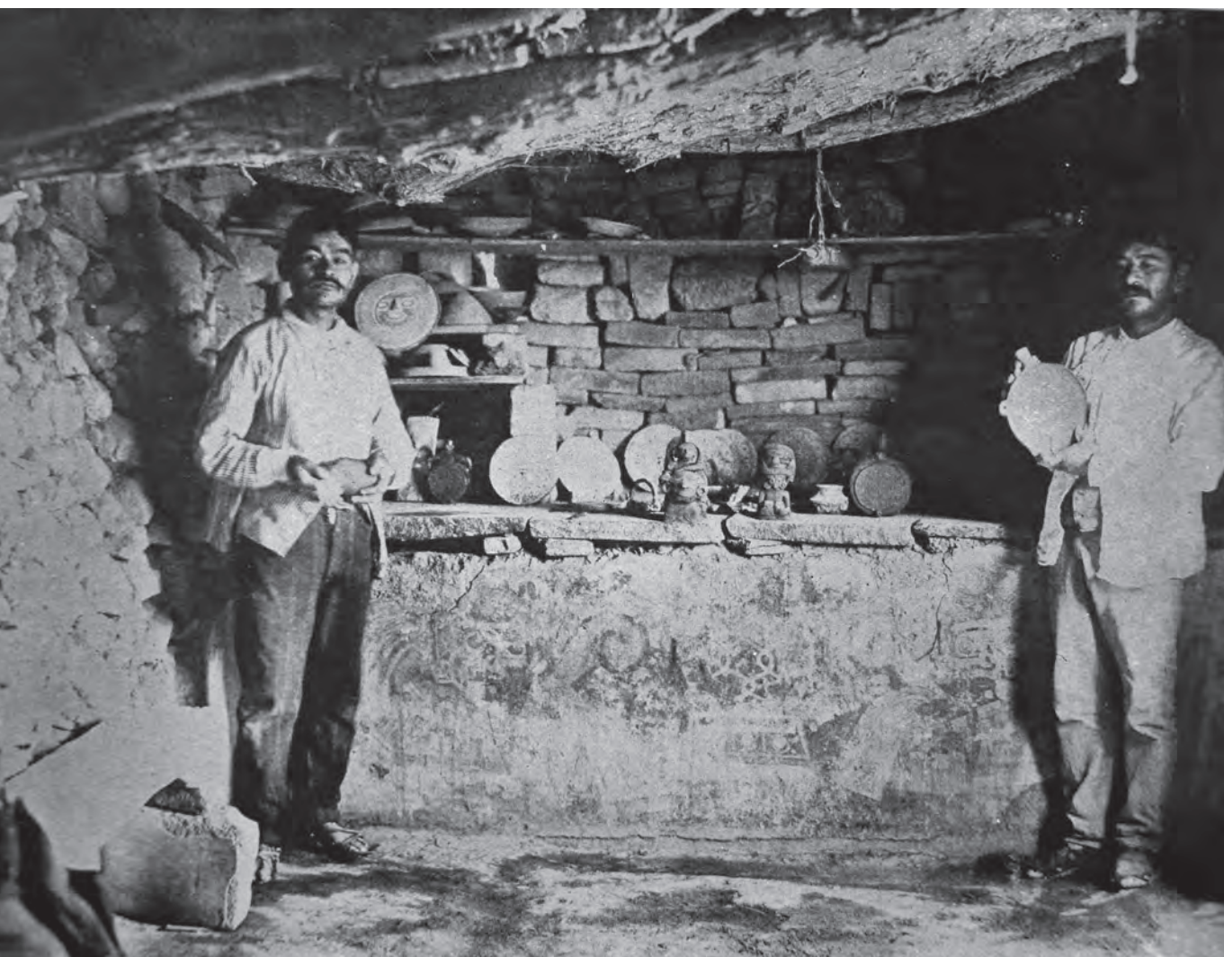
Autor no identificado, Los hermanos Barrios en su taller de moldeado y vaciado de falsificaciones , 1910

Leopoldo Batres Antigüedades mejicanas falsificadas: Falsificación y falsificadores.