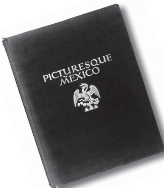
Hugo Brehme México pintoresco.

México-Berlin publicado por Hugo Brehme, 1923. 31 x 24.5 cm, 222 pp. Pasta dura. Con 197 fotografías impresas en heliograbado. Col. particular.