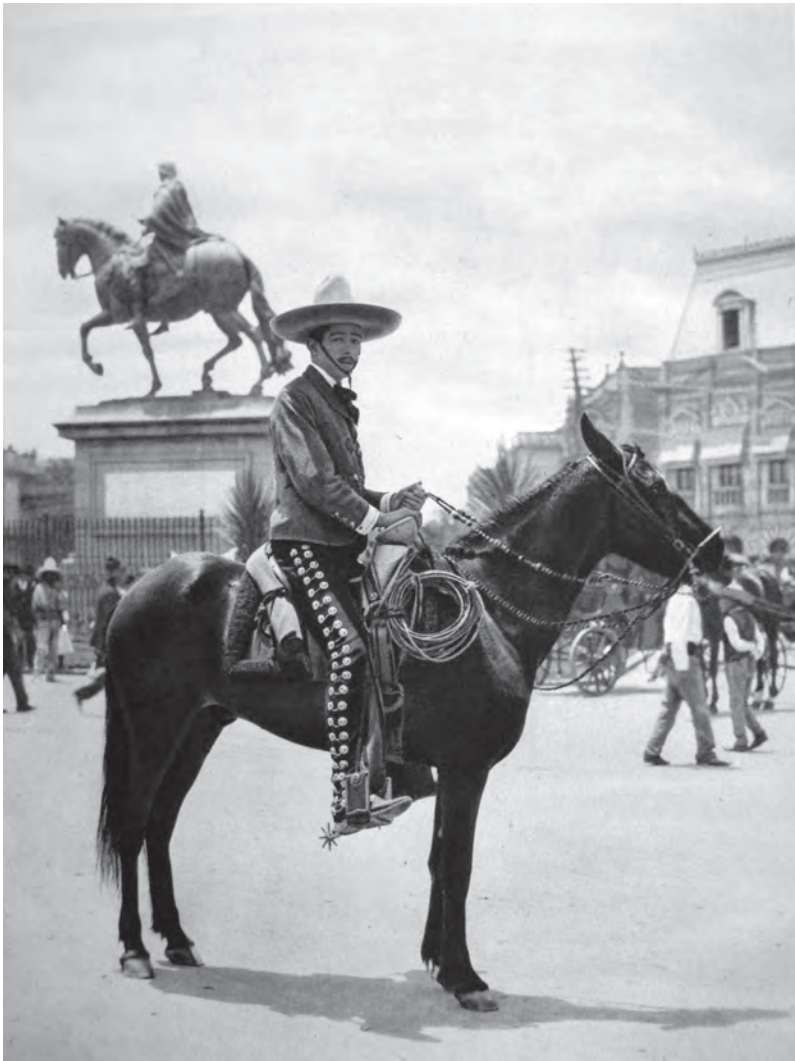
Hugo Brehme, Mexicano en traje de charro , 1923