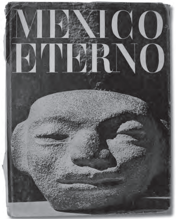
George Hoyningen-Huene México eterno. Tres panoramas.

Hoyningen-Huene, un estadounidense de origen ruso, fue un reconocido fotógrafo de modas inicialmente en París, donde comenzó su carrera, y posteriormente en Nueva York. Trabajó para la revista Harper's Bazaar , además de fotografiar a celebridades de Hollywood. Con una notable impresión en el libro, publicado simultáneamente en inglés (con el título de Mexican Heritage , Nueva York, J.J. Augustin Publishers), se despliega una serie de imágenes centradas en lo prehispánico, la arquitectura colonial, el paisaje semidesértico y la espesura selvática. México, desde la visión de Hoyningen-Huene, es un país monumental, y para tal efecto el fotógrafo eliminó la figura humana y creó más un registro desolado. Por ello Alfonso Reyes llegó a escribir: "Paisaje, arqueología mexicana y arte colonial integran el presente álbum, como tres fases indispensables del proceso. La época moderna es cosmopolita y anodina. Por eso se prescinde de ella. Y un noble escrúpulo por huir a las fáciles y engañosas tentaciones de la 'documentación turística', ha impuesto al creador de este álbum la brava consigna estética de suprimir la figura humana. El hombre sólo está presente en los ojos, es decir: en la contemplación...".