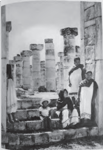
A GROUP OF MAYA AT THE ENTRANCE TO THE NORTH COLONNADE