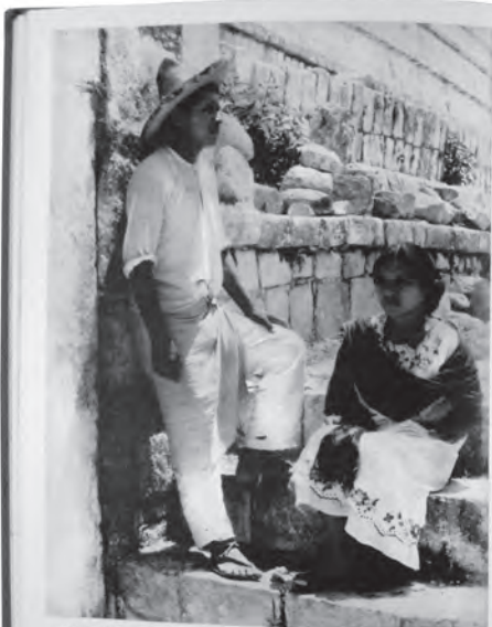
MAYA OF TODAY