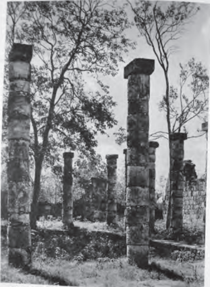
THE PERISTYLE COURT FROM THE FRONT HALL OF THE MERCADO