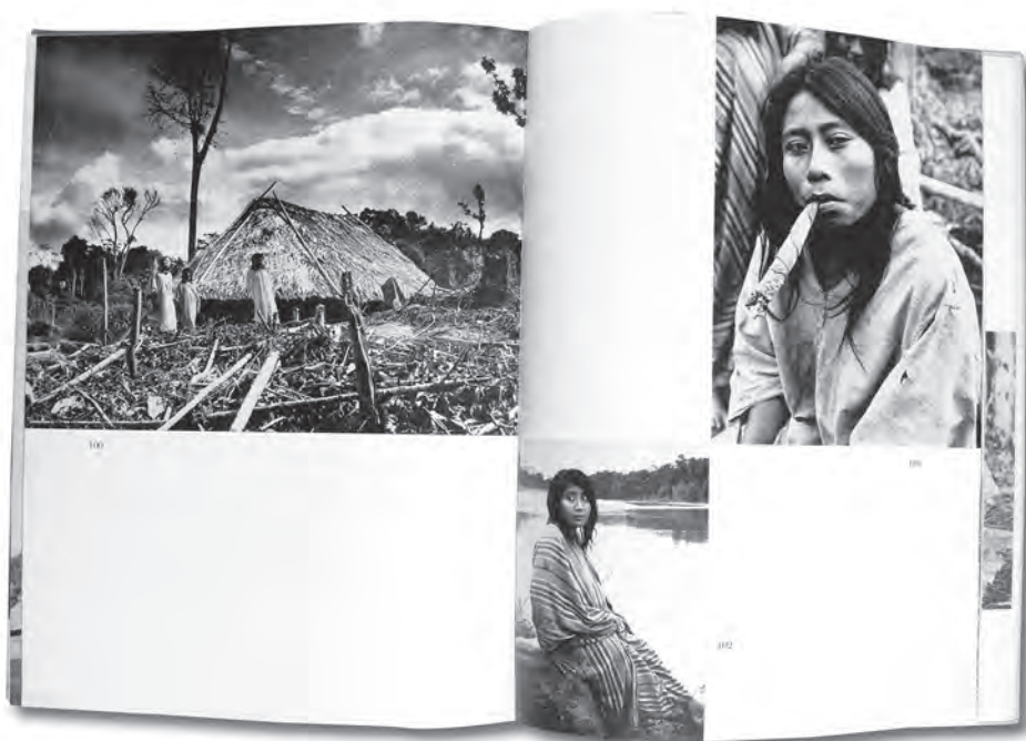
Gertrude Duby Chiapas indígena.

México, UNAM, 1961. 28 x 21 cm, 160 pp. Pasta dura con camisa. Con 135 fotografías en blanco y negro, 4 en color. Col. particular.