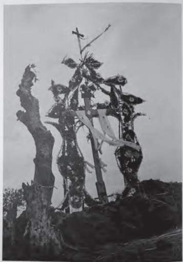
ARBORE DE CHALUCA. THE TRUNK OF CHALUCA. CAJAL DE CHALUCA. CHALUCA, MEXICO. 1932