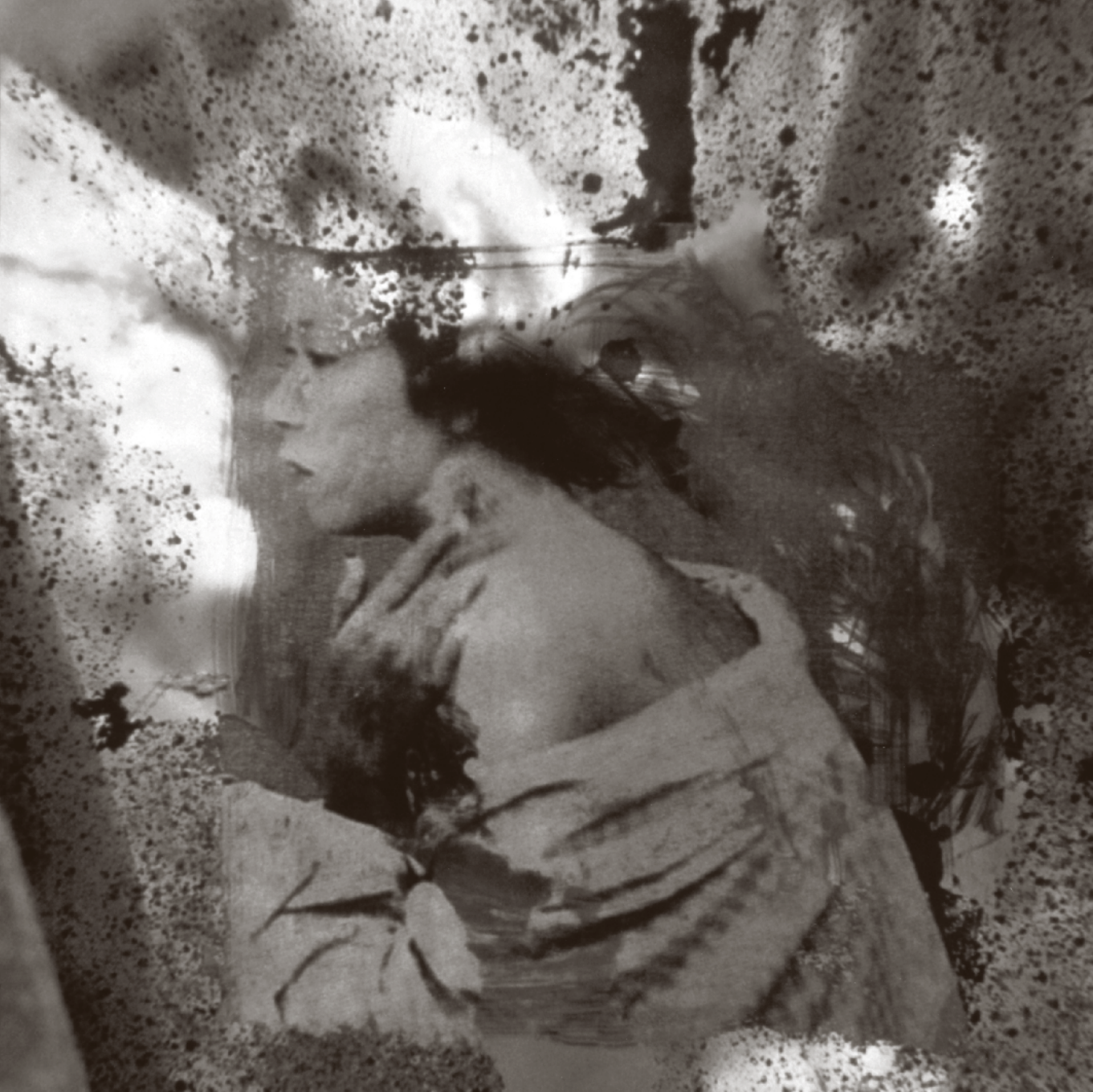
CARLA RIPPEY [868572] Floating World II , 1998, México, D.F. | Impresión digital [original en color]