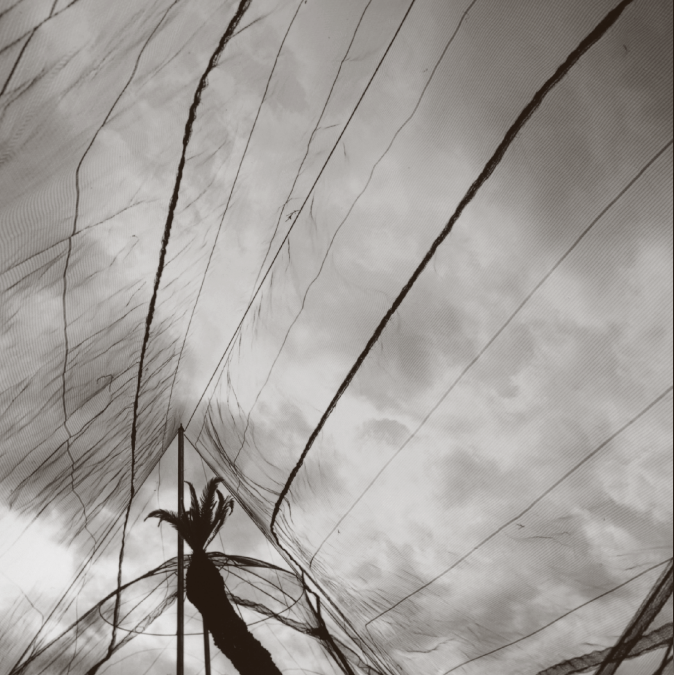
GRACIELA ITURBIDE [868905] Jardín Botánico , Oaxaca, 1997, México. D.F. | Impresión plata sobre gelatina Fondo Cien Fotógrafos Contemporáneos | CONACULTA.INAH.SINAFO.FN