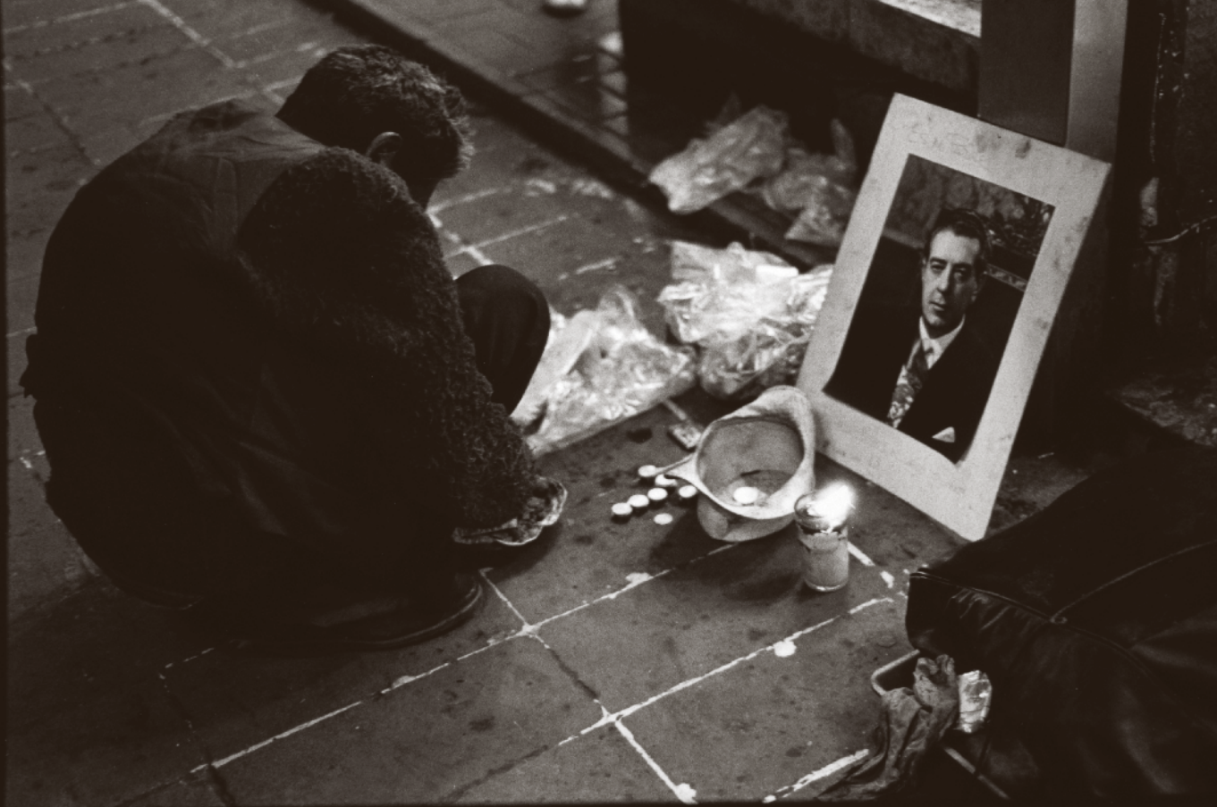
RUBÉN PAX [842340] El santo de su devoción , 1985, México, D.F. | Impresión plata sobre gelatina Fondo Cien Fotógrafos Contemporáneos | CONACULTA.INAH.SINAFO.FN