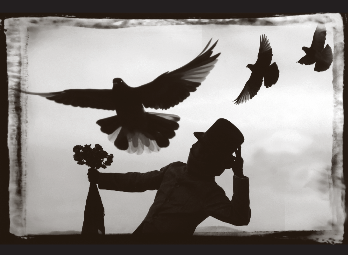
PEDRO MEYER [868587] Todos somos palomas , 2004, México, D.F. | Impresión giclée [original en color] Fondo Cien Fotógrafos Contemporáneos | CONACULTA.INAH.SINAFO.FN