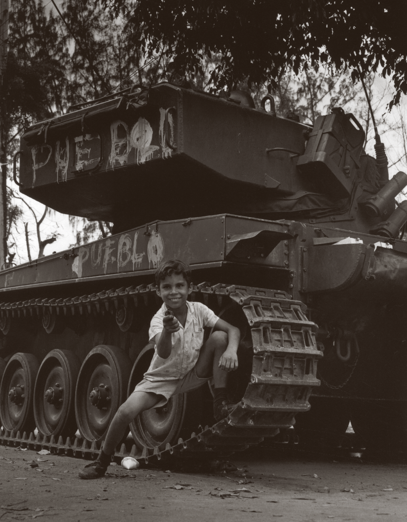
RODRIGO MOYA [842811] Juegos de Guerra , 1965, Santo Domingo | Impresión plata sobre gelatina Fondo Incremento Acervo. Fotógrafos Contemporáneos | CONACULTA.INAH.SINAFO.FN