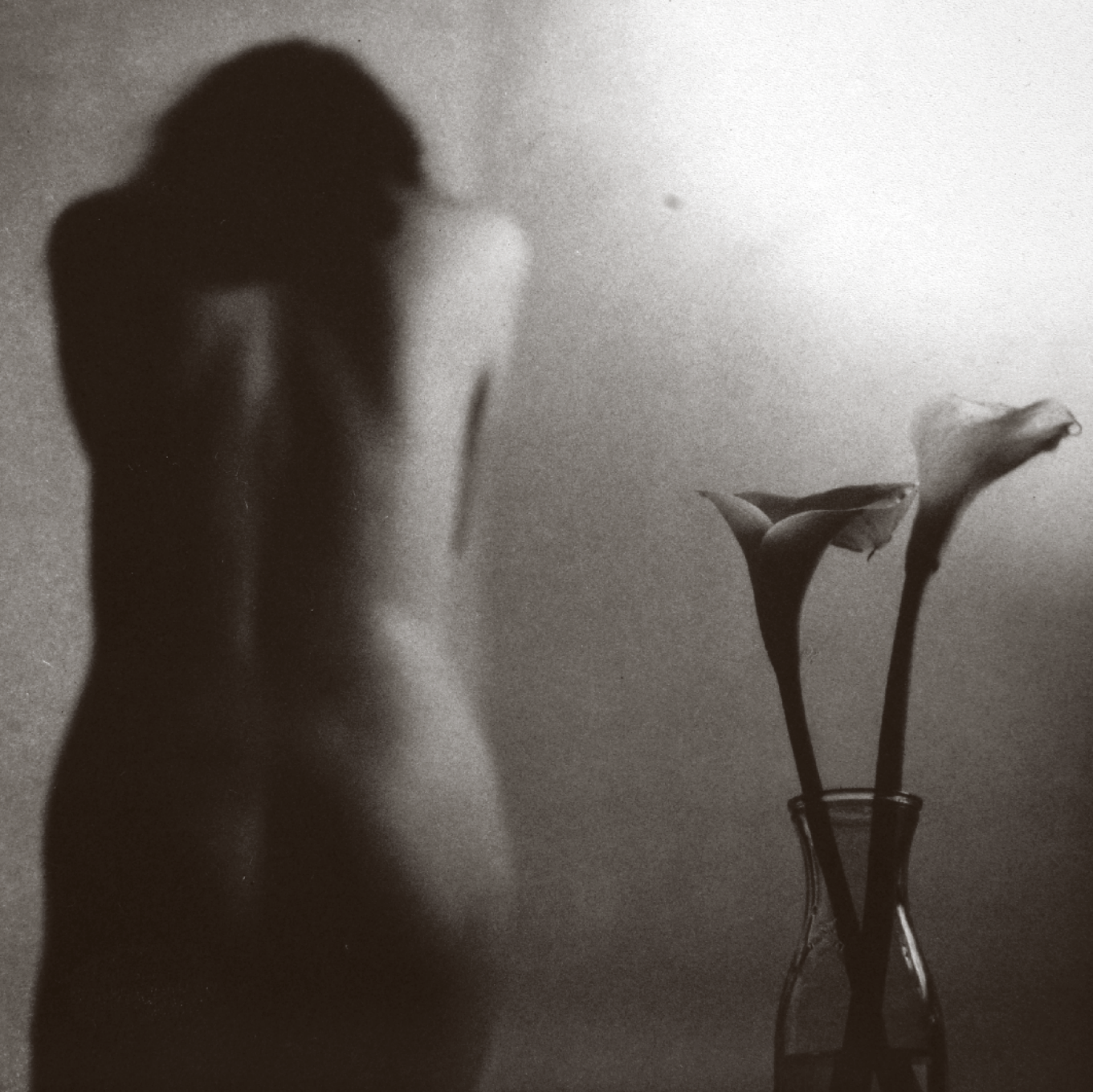
ADRIÁN MENDIETA [868482] Desnudo antiguo , 2004, Xalapa | Fotograbado