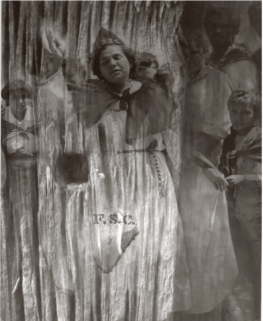
ERICK ESTRADA BELLMANN [868504] Cajita 2 , 2009, Espinazo, Nuevo León | Impresión digital [original en color] Fondo Cien Fotógrafos Contemporáneos | CONACULTA.INAH.SINAFO.FN