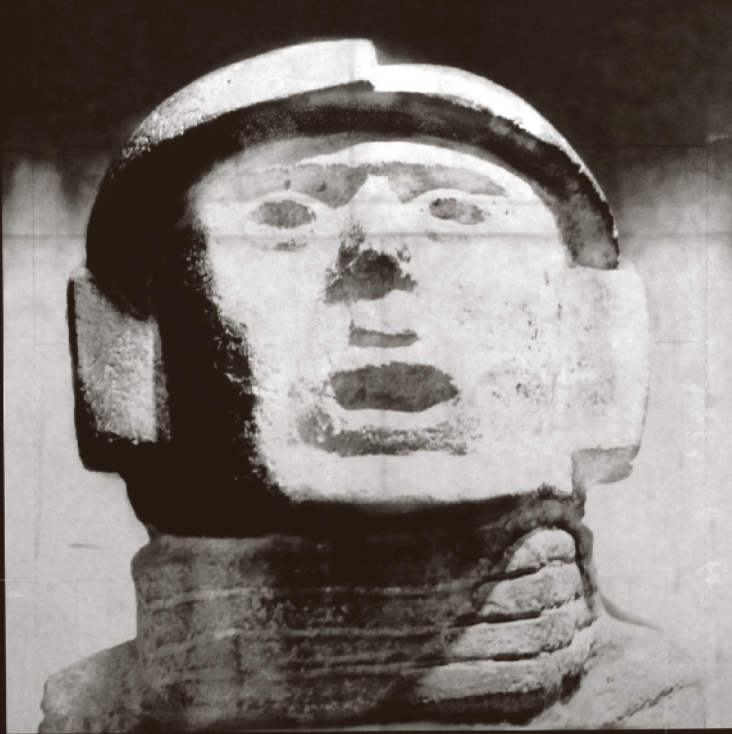
GERARDO SUTER [842788] Topiltzin , 1895, México | Impresión digital Fondo Incremento Acervo. Fotografos Contemporáneos | CONACULTA/INAH.SINAFO.FN