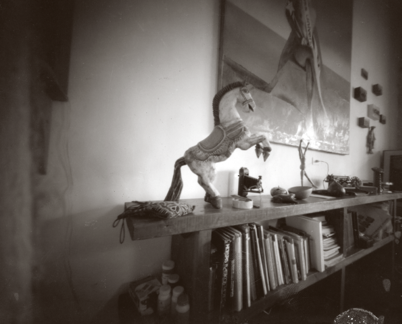
CARLOS JURADO [861573] Caballito , 1982, Veracruz | Negativo de película de seguridad