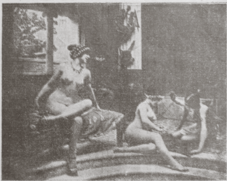
Galantería de los Estudios "Cadeti" a los lectores de "VIDA ALEGRE"

Galantería de los Estudios Cadeti en Vida Alegre , México, s/f [ca. 1933] Col. Miguel Ángel Morales.