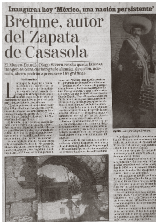
Reforma, México, 4 de octubre de 1995 Col. particular

Más para ahondar en el dilema de la imagen del retrato de Zapata, he de aclarar que tras analizar cuidadosamente la pieza negativa me percaté de que se trata de una reprografía, donde es posible