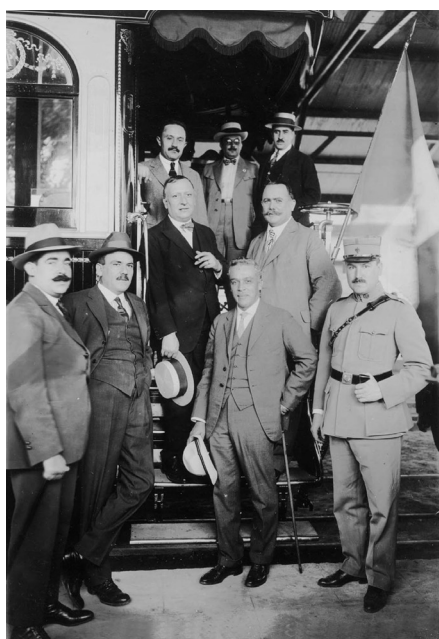
Autor no identificado Álvaro Obregón con sus colaboradores en la estación Villa Reyes, San Luis Potosí, 1921