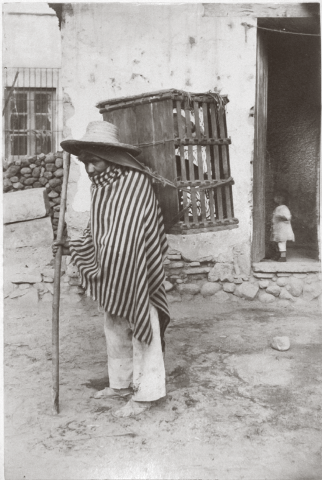
HUACALERO ESTADO DE MEXICO