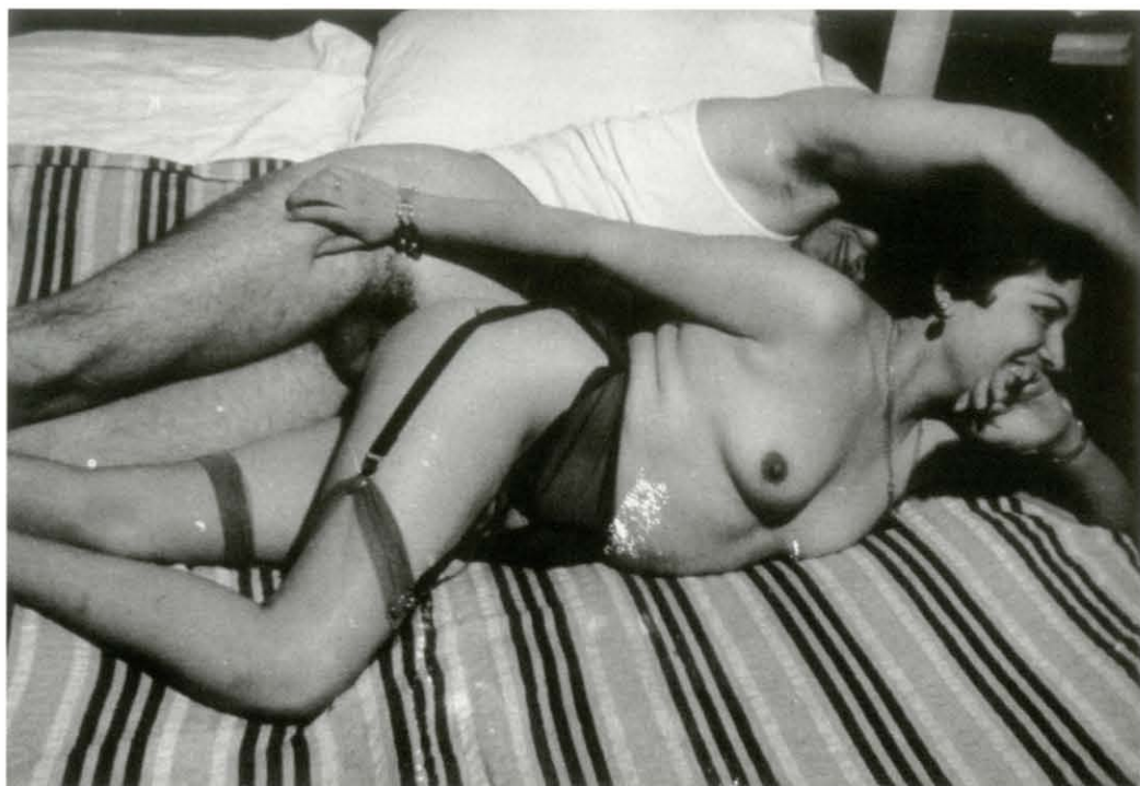
Autor no identificado, Sin título, ca. 1945. Col. particular Abajo: Vea , México, 13 de enero de 1950. Col. Hemeroteca Nacional, UNAM

especialista en desnudos”, que fue sentenciado a dos años de prisión, mientras que ella a “dos meses de cárcel sin multa”. Después, en la Ciudad de México, posó para un aficionado muy rico, a quien contactó a través de un anuncio, que tenía la “manía de retratar a una misma modelo sólo una vez”. Luego un amigo le señaló que: