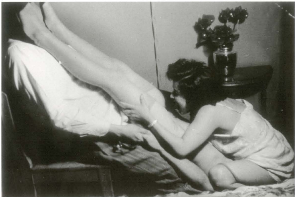
Autor no identificado, Sin título, ca. 1945. Col. particular

del Magazine de Policía , donde reinó la escenografía reducida a una habitación, una producción pobrísima y personas de bajo nivel como actores. Una atmósfera similar se advierte en los cortometrajes pornográficos, que debió de filmar a finales de la década de los veinte y a principios de los treinta, pero ahí priva un hu-