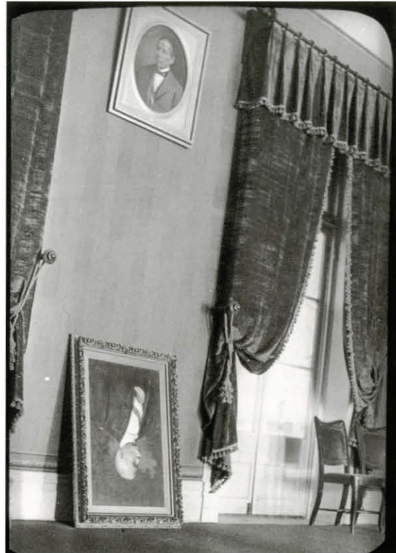
Jimmy Hare, Después de la batalla de Ciudad Juárez, 9 de mayo de 1911.