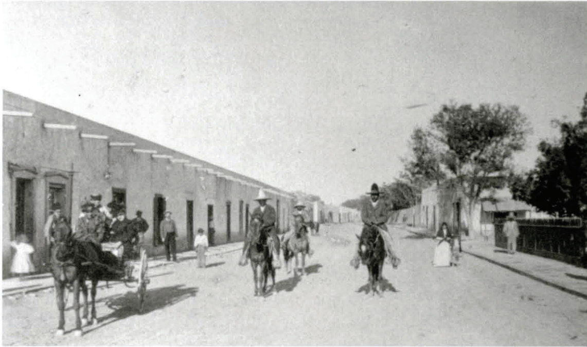
Autor no identificado, Escena callejera en Juárez , tomada del álbum Souvenir of El Paso, Texas , Brooklyn, Nueva York, The Albertype Co., s/f [ca. 1900]. Col. biblioteca particular