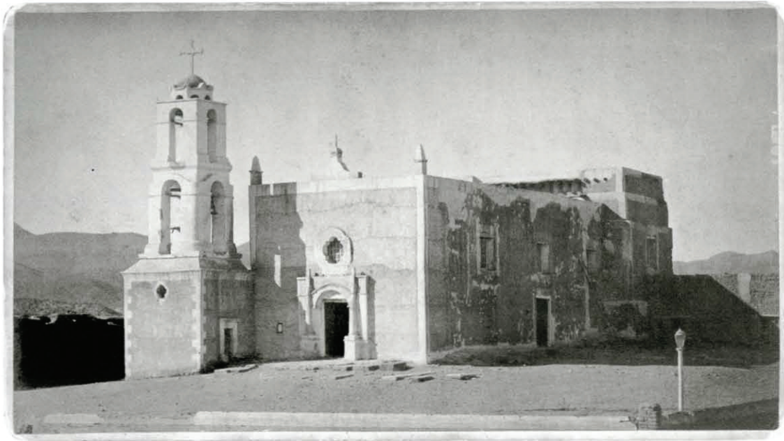
Misión de Guadalupe, ca. 1885.