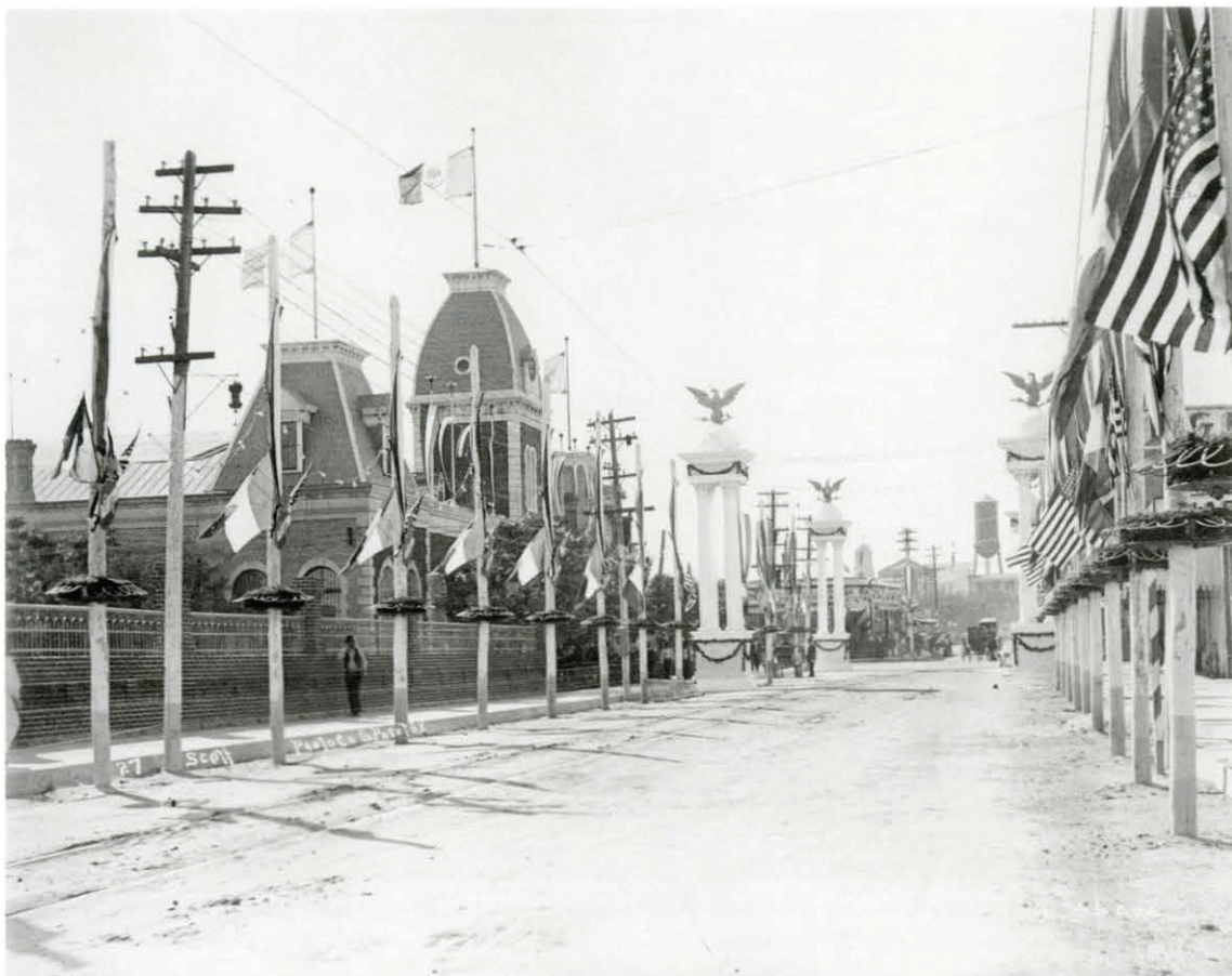
Preparativos para la entrevista Díaz-Taft , octubre de 1909.

imágenes fueron publicadas en varios periódicos de Estados Unidos y por lo menos en uno de Europa, gracias a que la Associated Press de Nueva York vendió a varios de ellos las fotografías que había comprado al estudio paseño. Lo mismo hizo la revista Collier's , que durante la primera etapa de la Revolución compró a Scott algunas fotografías, las cuales no sólo publicó, sino que a su vez las vendió a L'Illustration de París, en marzo de 1911. 11