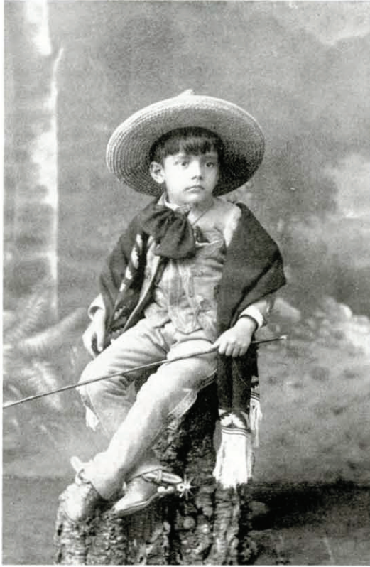
Charles F. Lummis, Charrito , en The Awakening of a Nation , Nueva York, Harper, 1898. Col. Honnold Library, Claremont Colleges, California