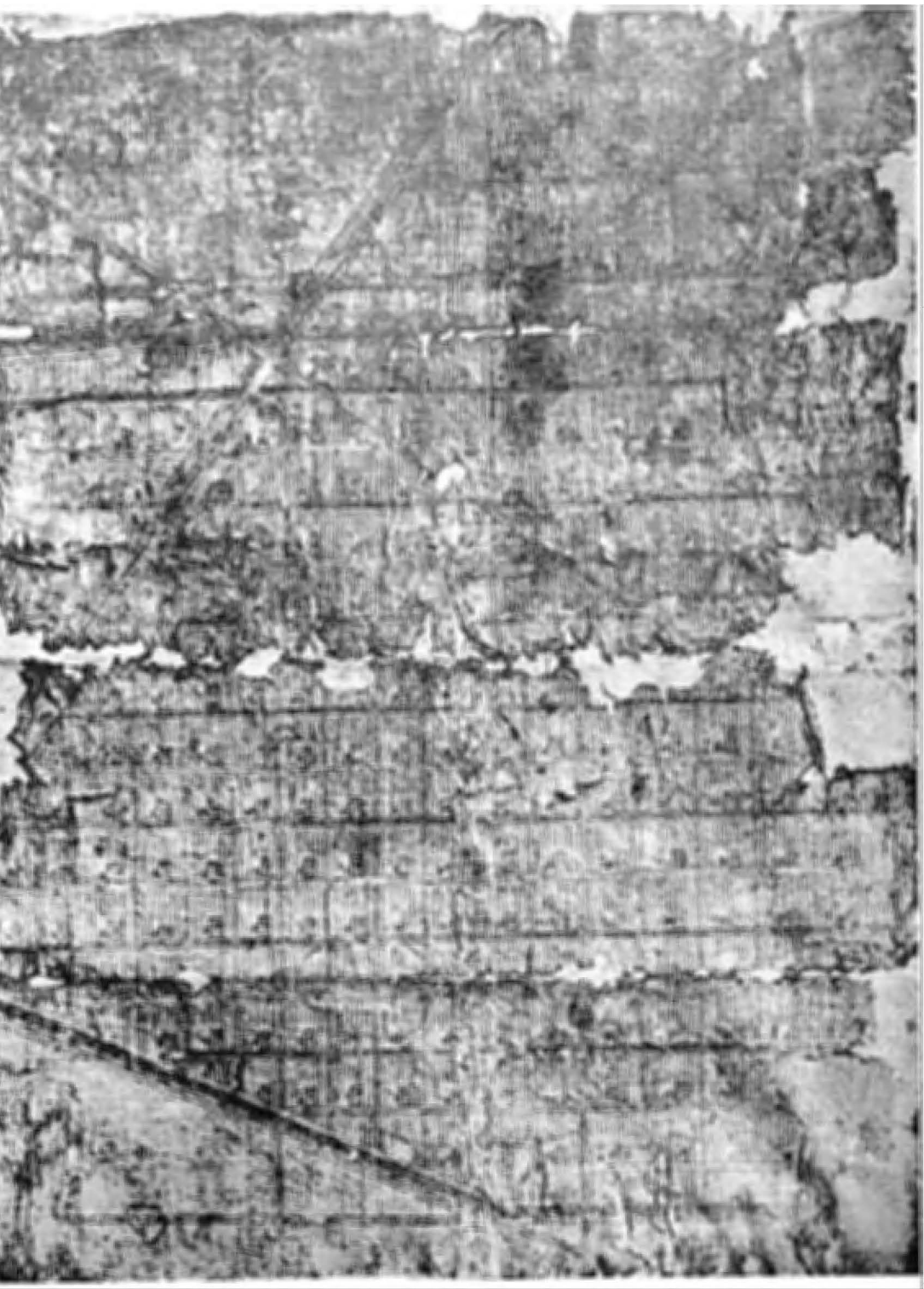
...Y, QUE SE CONSERVA EN ESTE MUSEO.