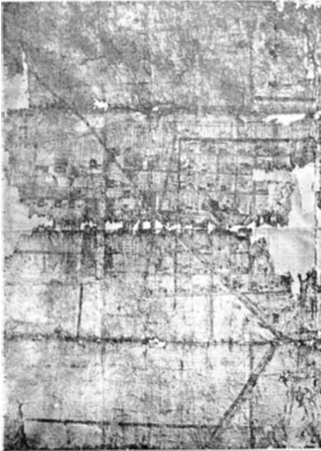
PLANO HECHO EN PAPEL DE MAGUE