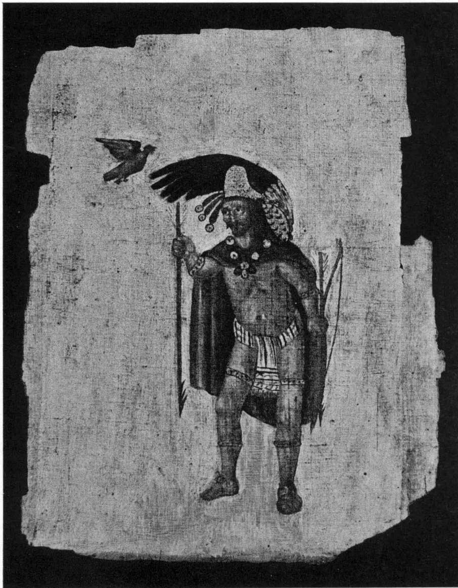
CUAUHTÉMOC (según un códice post-cortesiano).