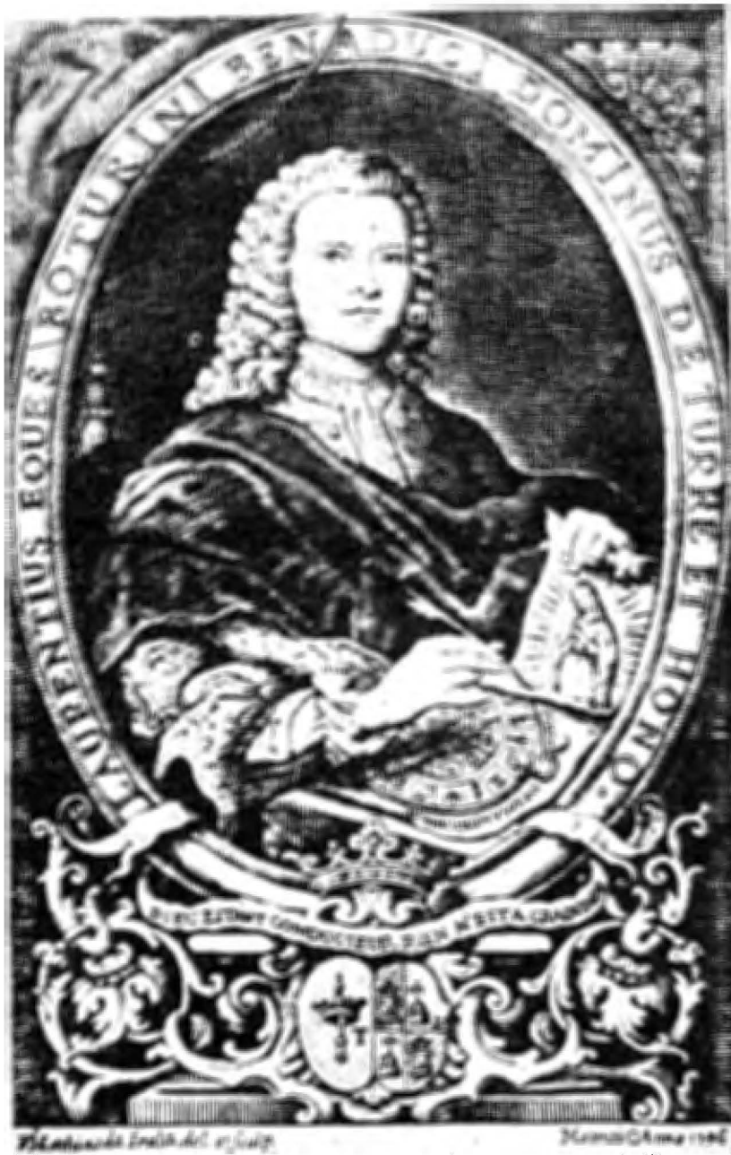
El Caballero don Lorenzo de Boturini y Benaducci.