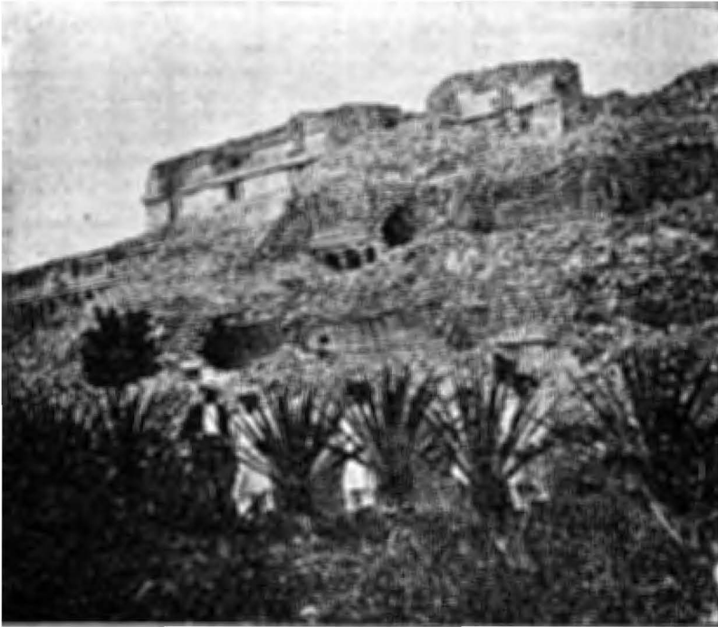
1.—El Palacio o Casa Grande.—Vista General.