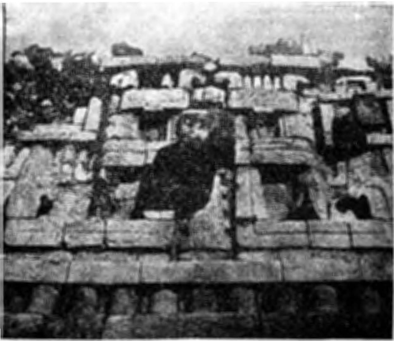
2.—El Palacio.—Otro detalle de la decoración del friso sobre las entradas de los pórticos.