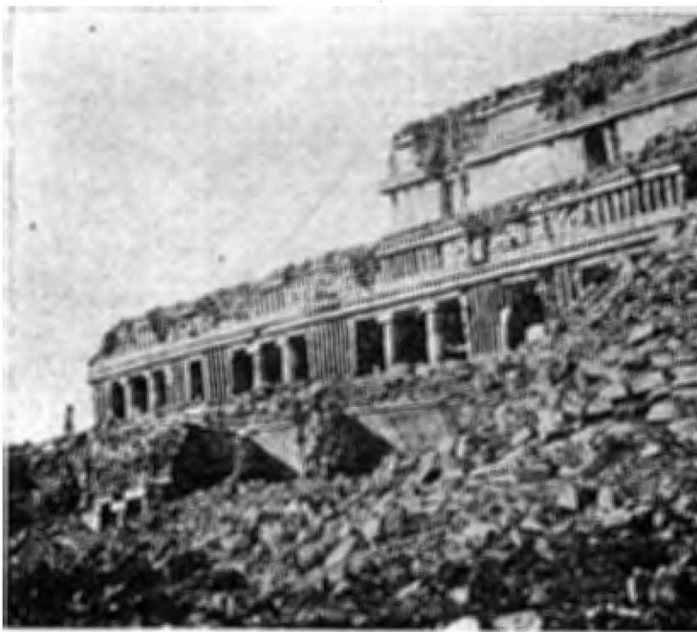
1.—El Palacio.—Detalle del extremo E. del lado S.