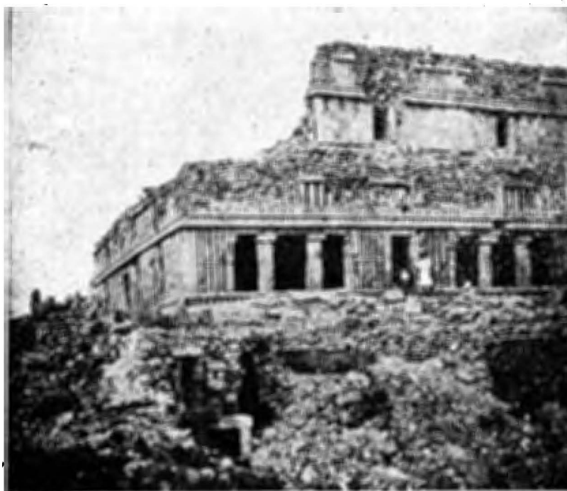
2.—El Palacio.—Angulo S. W.