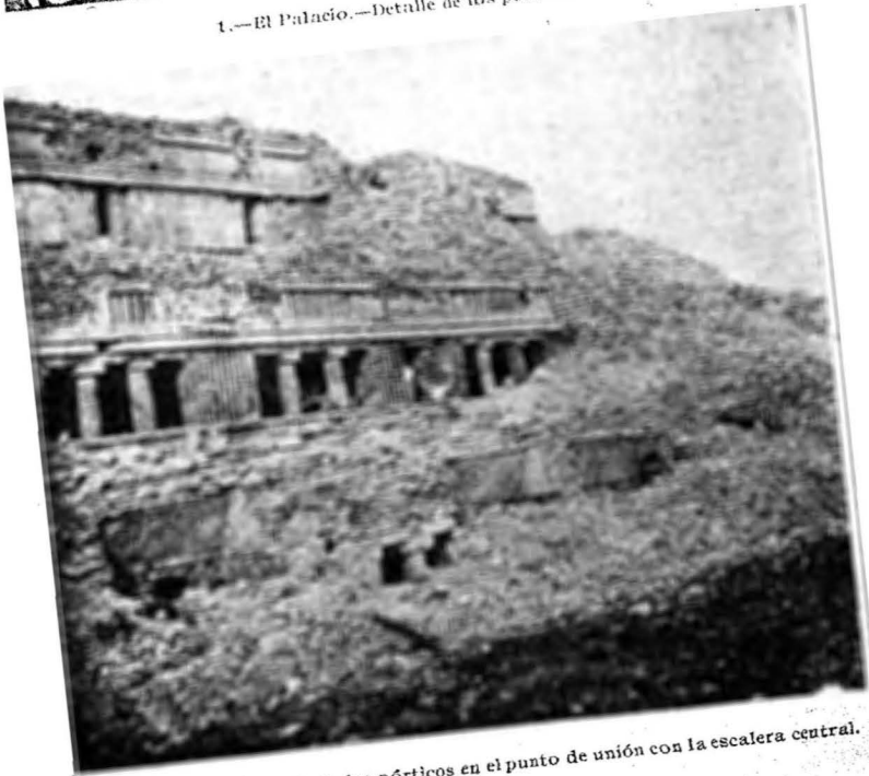
2.—El Palacio.—Detalle de los pórticos en el punto de unión con la escalera central.