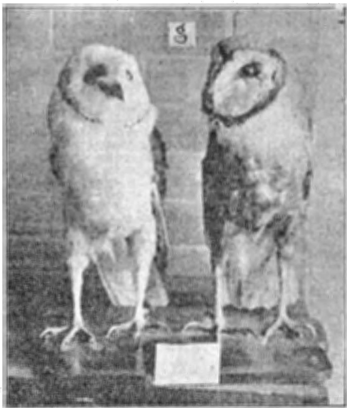
Fig. 1.—Ejemplares de "Strix Perлата" y Syrinium Sartorii."