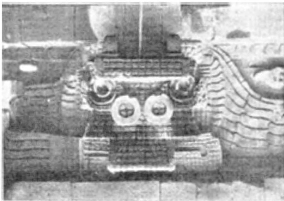
Fig. 5.—Escultura en piedra de la ciudadela de Teotihuacán representando un buho estilizado e identificado como el dios Tlaloc.

pacio, entre la figura central o sea la cara del buho y la franja decorativa.