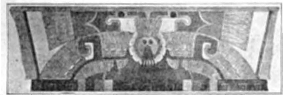
Fig. 3.—Presco que representa un buho que estaba en el Templo de la Agricultura en San Juan Teotihuacán, y cuya copia existe en el Museo Nacional.

cida esta figura e identificada como un buho estilizado. Creemos no puede dudarse más que se trata de este animal por el acopio de detalles que lo demuestran, aunque a otras interpretaciones se ha prestado. Algunas personas han querido ver en esta figura la representación de una mariposa. Para ello explican que los motivos ornamentales rojos son las antenas del insecto y las tiras café, la trompilla del animal. Estos detalles bien pueden representar una mariposa, mas, lo restante de la figura, las semicirculares, las plumas claramente representadas indican terminantemente que se trata de una ave.