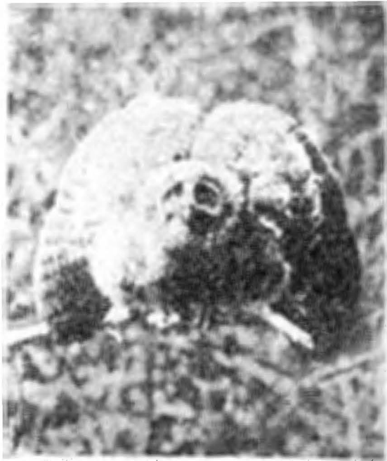
Fig. 4.—Buhu en actitud de enojo. Bubo virginianus (?).

Por la fig. 4 a , 3 en que presentamos la fotografía de un buho en momentos de extender las alas se notará la gran semejanza que presenta hasta en sus menores detalles. Se podrá ver que visto de frente el pico del ave presenta una forma de trompo; los ojos perfectamente circulares hallan su paralelo en la figura dibujada, y la golilla rosa son las plumas erizadas del buho. En cuanto a las alas, mayor semejanza encontramos; éstas se dirigen hacia afuera y hacia abajo, y finalmente, el cuerpo propio del animal está representado en la figura por el dibujo rojo que llena el es-