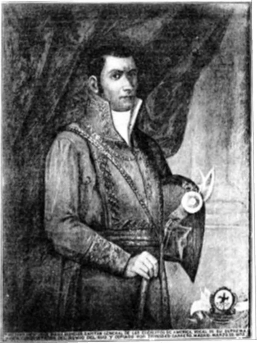
D. José María Morelos y Pavón.