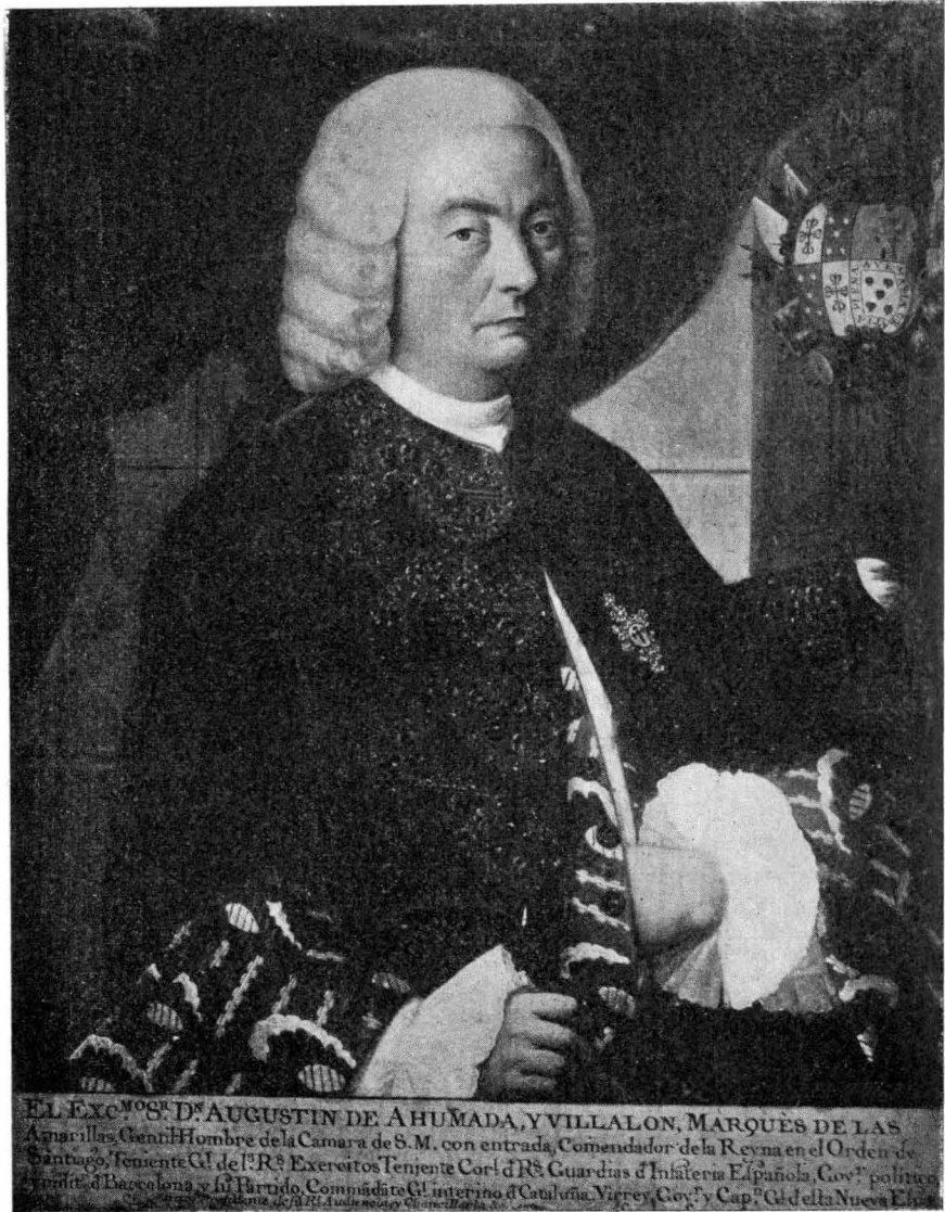
EL EXC. MO D. N AUGUSTIN DE AHUMADA, Y VILLALON, MARQUÊS DE LAS Amarillas, Canónigo de la Cámara de S. M. con entrada, Comendador de la Reyna en el Orden de Santiago, Teniente G l de l. o R. o Exército, Teniente Cor l d o R. o Guardias d o Infantería Española, Gov. o político de Cataluña, y el Partido, Comandante G l interino d o Cataluña, Virrey Gov. o y Cap. o G l de la Nueva España.