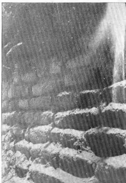
Fig. 2.—Detalle de los muros en talud.