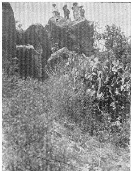
Fig. 7.—Peñascos que ofrecían una defensa a los antiguos habitantes de los edificios de La Gloria.