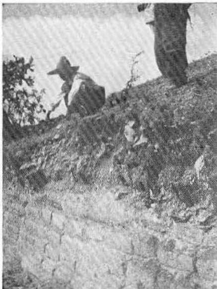
Fig. 1.—Muros en talud escalonados que limitan las terrazas de los monumentos de La Gloria.