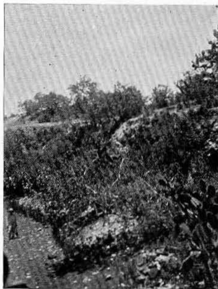
Fig. 6.—Depresiones naturales que ocurren en un lado del cerro y de donde fueron quizás extraídos los materiales de construcción.