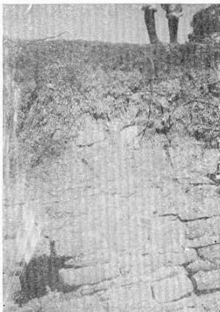
Fig. 3.—Muro correspondiente a la construcción más antigua de los monumentos de La Gloria.