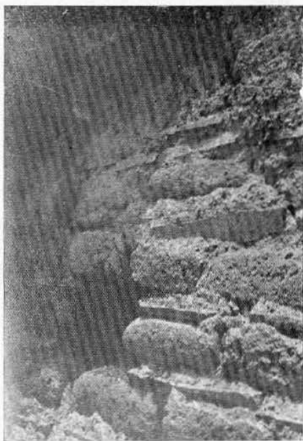
Fig. 4.—Detalle de la primera construcción de los edificios de La Gloria. En este caso las losas van reforzadas con lajas.