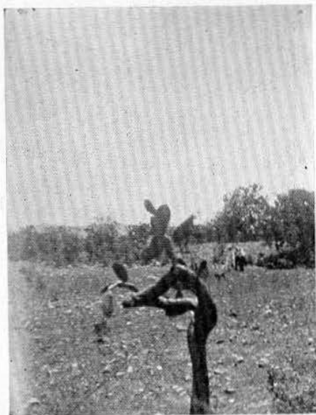
Fig. 5.—Patio situado en la parte más alta del cerro de La Gloria, limitado por cuatro edificios.