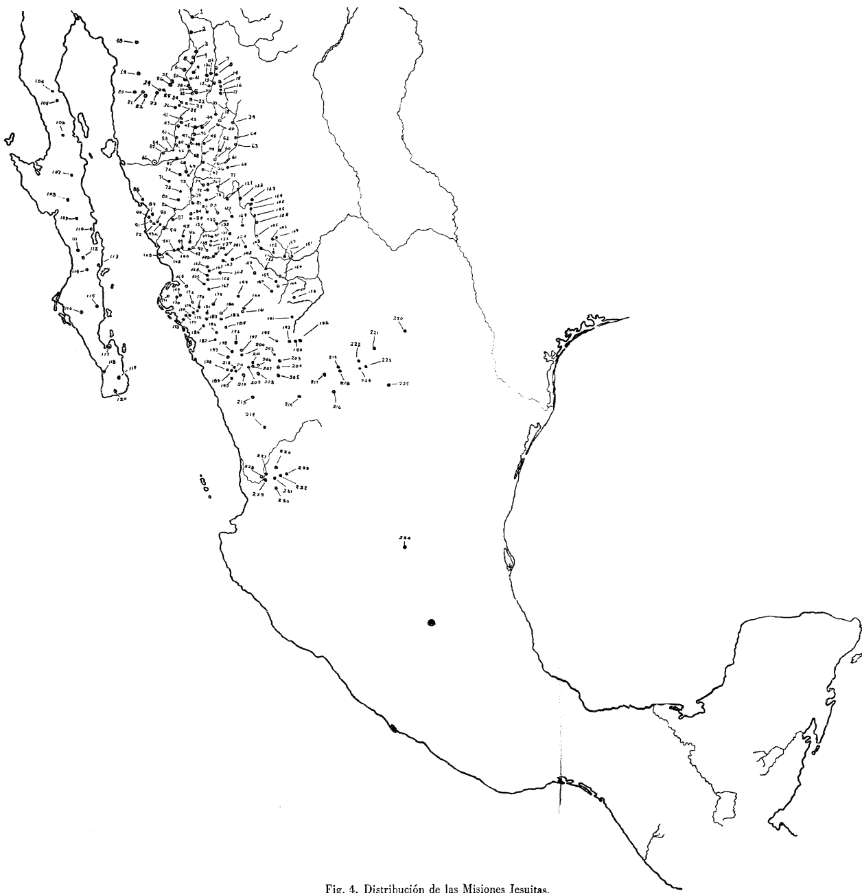
Fig. 4. Distribución de las Misiones Jesuitas.