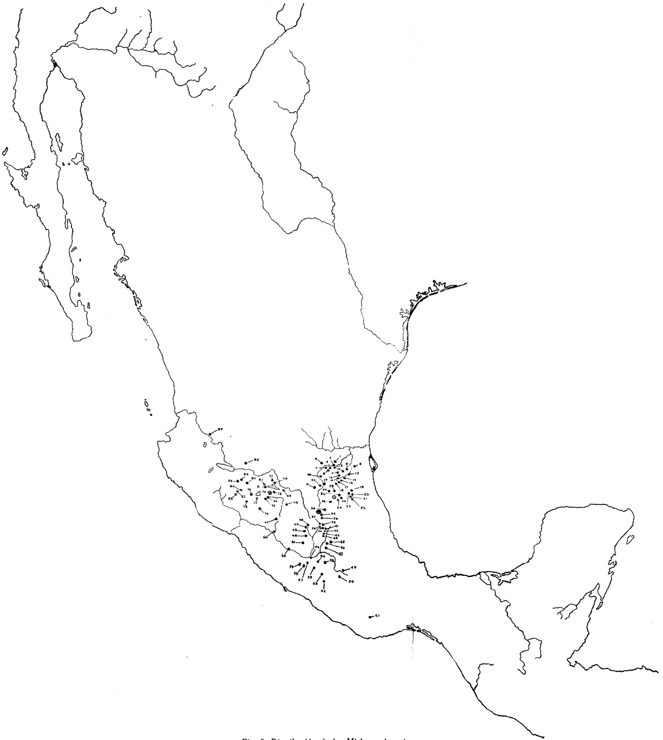
Fig. 3. Distribución de las Misiones Agustinas.