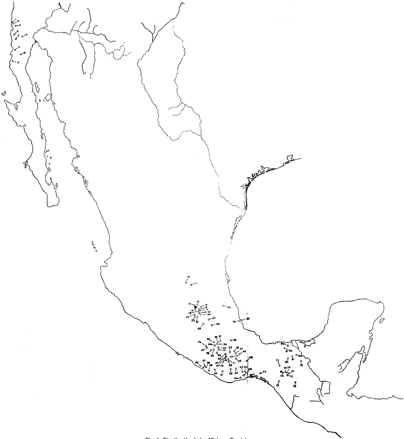
Fig. 2. Distribución de las Misiones Dominicanas.