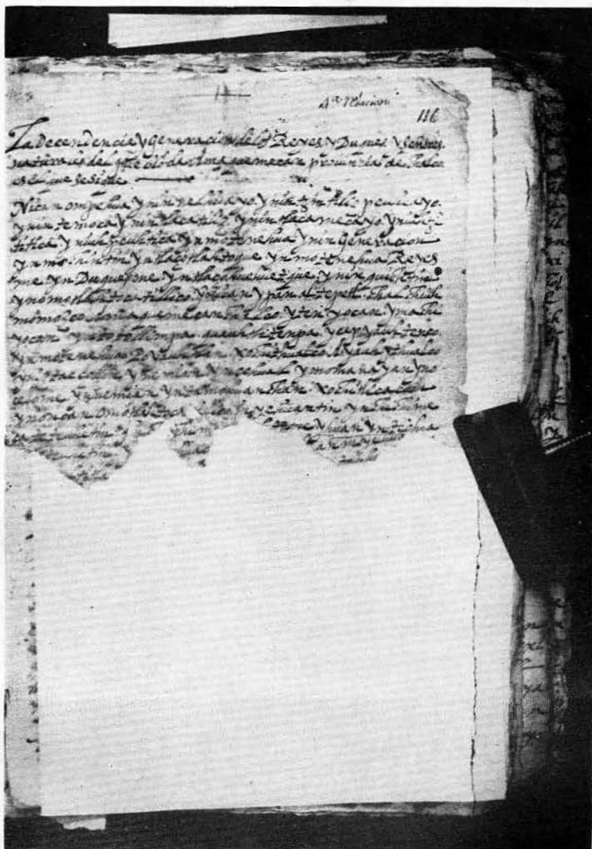
Principio de la Cuarta Relacion en el folio N° 116.