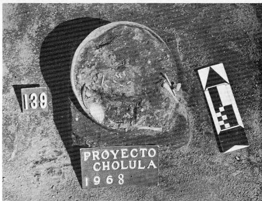
Lám I. Entierro en vasija de un infante muerto poco después de nacer. Se hallaron 8 de estos entierros primarios en vasija, la mayoría con restos de cuerpos de edad infantil

Quizá se trate de una modalidad encaminada a procurar mayor protección a algunos cadáveres infantiles y fetales, pero que no llegó a generalizarse en Cholula.