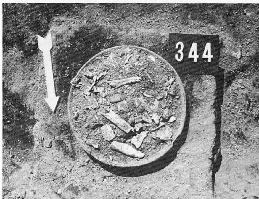
Lám III. Plato con los restos de un entierro secundario, en el cual se encontraron evidentes pruebas de cremación. Se hallaron 42 de estos entierros