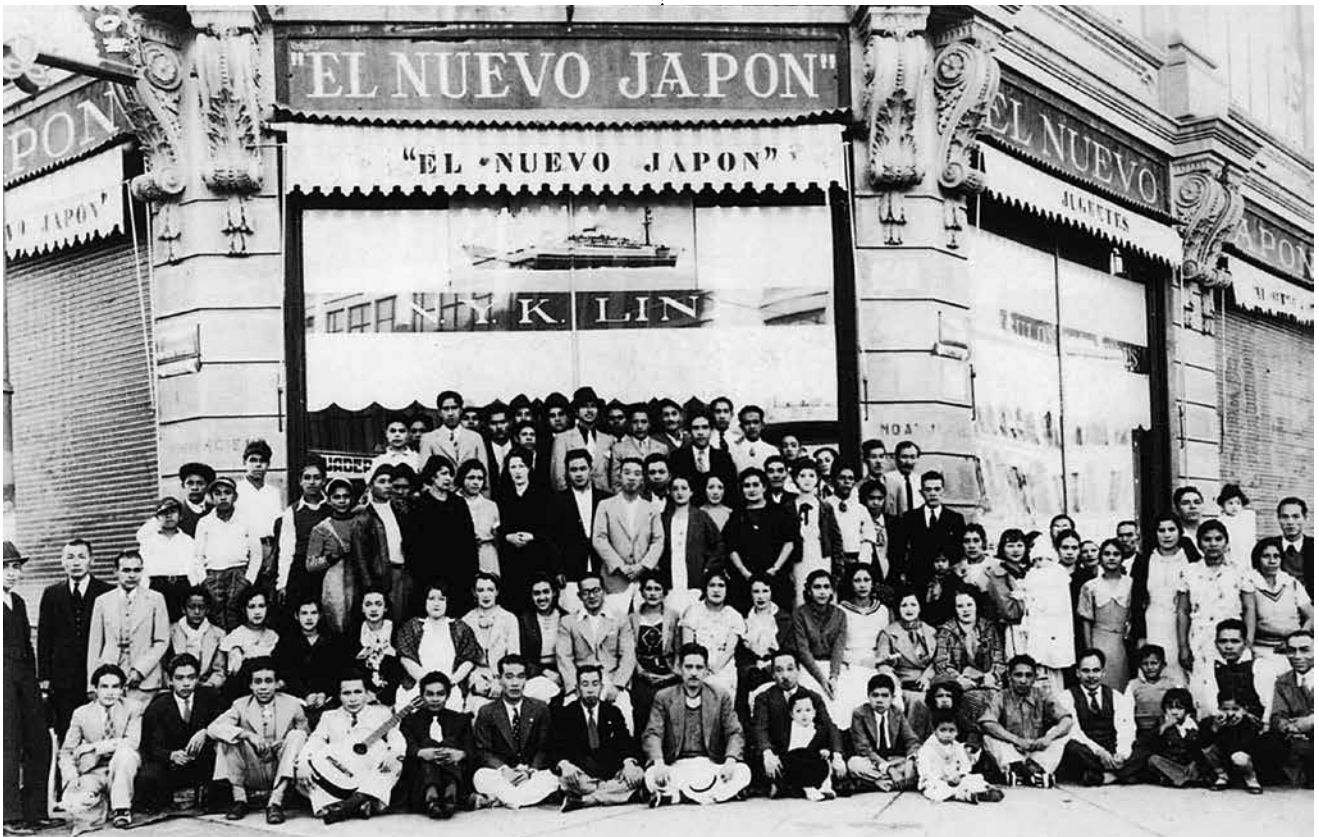
Cerca de 100 personas, entre empleados y sus familias, reunidos enfrente de la tienda antes de la partida del viaje de los empleados (1932).

empezó también a administrar compañías de botones de concha y lápices.