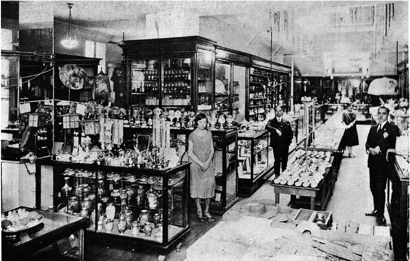
Interior de El Nuevo Japón (1932) (México, El Gran Tesoro).