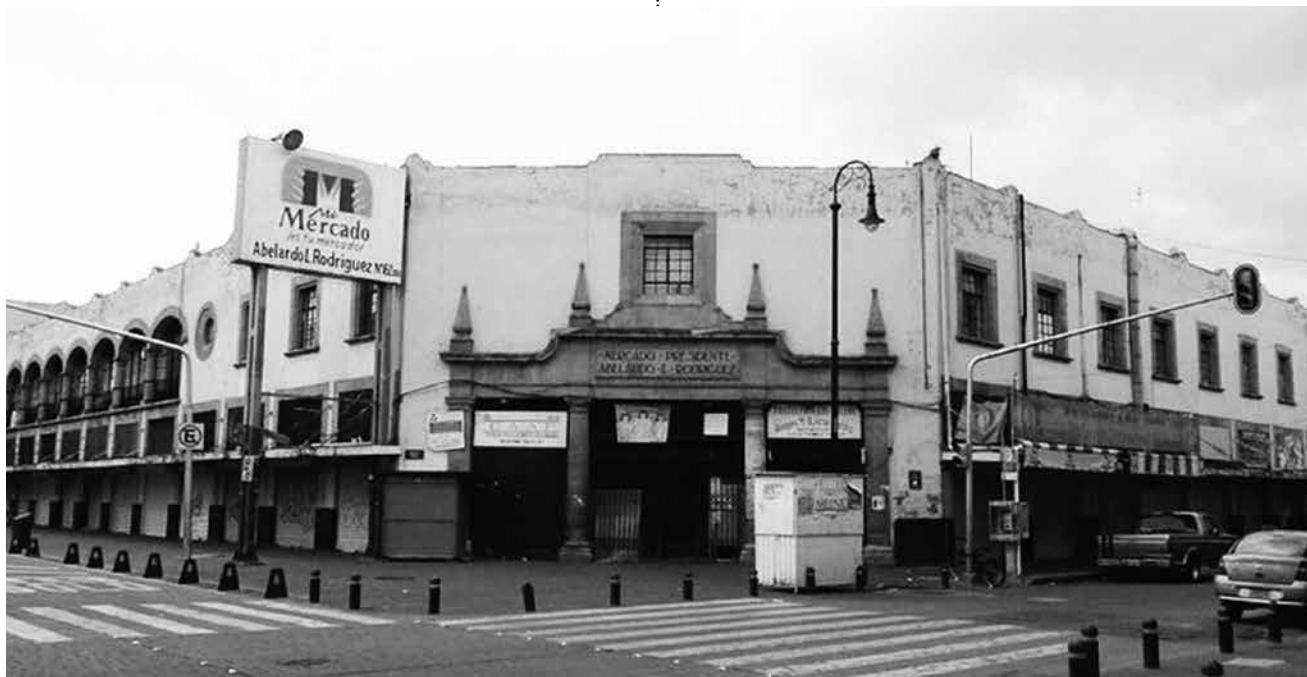
Mercado Abelardo Rodríguez. Sobre esta entrada se encuentra la obra de Noguchi.

dominaba la escena artística de México; pero Isamu, sin intimidarse, tuvo citas secretas con ella, cambiando los lugares de encuentro de manera constante. Frida, quien era tres años menor que él, se apasionó por Isamu, y casi no se encontró con el lienzo, disfrutando de sus citas. La única obra que dejó de esa época fue Unos cuantos piquetitos .