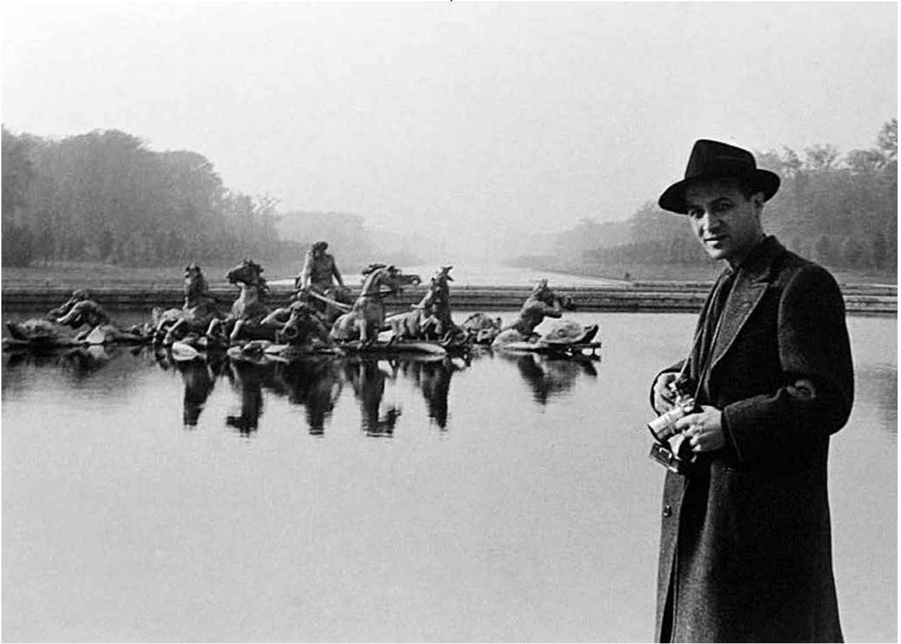
Retrato de Isamu Noguchi.

mercado del que México se enorgullecía. En sus paredes internas se realizaron diversos murales pintados por diez artistas: seis jóvenes mexicanos, tres estadounidenses e Isamu Noguchi; todos ellos dirigidos por Diego Rivera. En el mural en relieve cuyo título es La Historia de México , Noguchi utilizó cemento y ladrillos rojos. Los temas principales que se plasmaron refieren a obreros oponiéndose al fascismo y al nazismo; la fuerza de agricultores y mineros, así como la discriminación racial. La dimensión de la obra es de 2 metros de altura por 22 de largo; la obra está repleta de cráneos, grúas, obreros aplastando la esvástica o cruz nazi, un puño gigante que se yergue e incluso una hoz y un martillo, símbolos del comunismo.