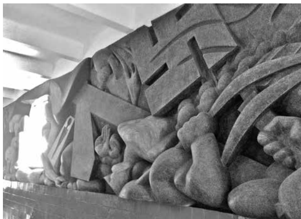
La obra de Isamu Noguchi en el mercado Abelardo Rodríguez.

Isamu y Frida idearon un plan con el propósito de compartir un departamento para sus citas secretas.